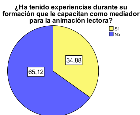
Figura 14. Porcentaje ítem 9

Continuando con la pregunta número 9, observamos en la Figura 4 los resultados de todo el conjunto de casos. Destaca que un 65% niega haber tenido una formación práctica para la promoción de la lectura.