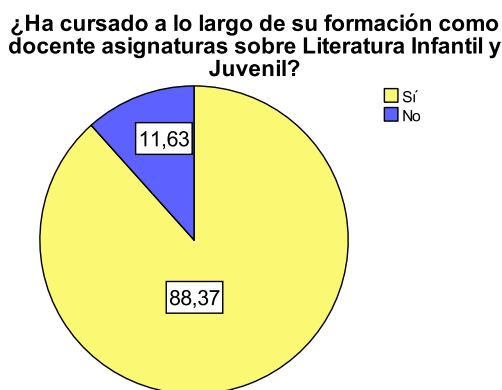
Figura 1. Porcentajes de respuestas del ítem 2.1

Continuando con las preguntas sobre la presencia de la LIJ en las asignaturas cursadas durante la formación académica, un 11.6% de los alumnos considera que no ha cursado asignaturas donde se trabaje la Literatura Infantil y Juvenil (Figura 1). Tres de los participantes justifican que no han cursado asignaturas como tal, sino que simplemente la han trabajado como un parte dentro de otras asignaturas más amplias.