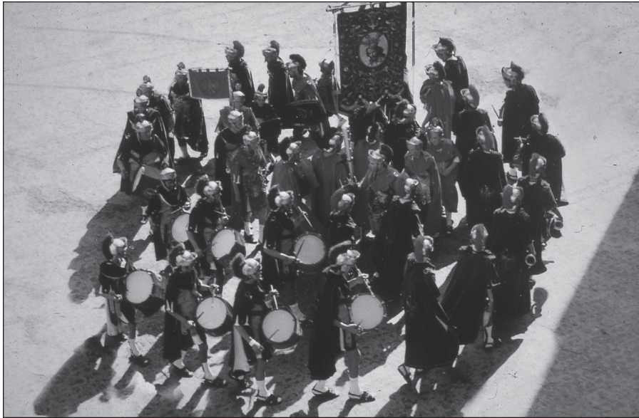
FOTO 1: «Armaos» de Jumilla realizando la danza del caracol, según foto publicada en una guía de Cofradías de Semana Santa de Jumilla.

En Aledo, del mismo modo, nos indicó el doctor Francisco Flores Arroyuelo , el día de Viernes Santo los «armaos» ejecutaban sus círculos delante de la plaza del ayuntamiento pero también dentro de la iglesia. La escena es tétrica, porque a la luz de las velas, las gentes hacen resonar trozos de madera, como indicando que un cataclismo se ha desatado por la muerte de Cristo. En esos instantes penetran los legionarios y un centurión atraviesa con su lanza a Jesús, mientras el sacerdote cubre con un velo el rostro de María, para que la Madre no vea el último instante de su Hijo. Cristo será depositado en brazos de la Dolorosa.