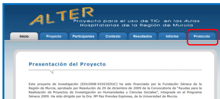
Figura 2. Acceso al PAER

A continuación procedemos a la presentación y descripción del PAER. Para visualizarlo podemos acceder mediante la página web del Proyecto ALTER: http://www.um.es/aulashospitalarias/ (Figura 2).