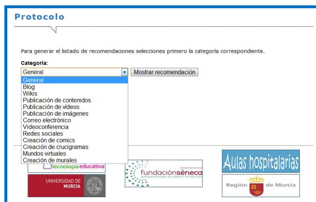
Figura 5. Recomendaciones de uso de las herramientas Web 2.0

6. Si accedemos a la imagen del búho podremos ver las recomendaciones de uso de las herramientas Web 2.0 que los investigadores proporcionamos a los maestros de las aulas hospitalarias. Estas recomendaciones están organizadas por categorías, tal y como podemos ver en la figura 5. Existe en primer lugar una categoría llamada “general”, en la que se ofrecen unas pautas de uso y recomendaciones generales de las herramientas telemáticas. Al seleccionar una de las categorías, y tras hacer clic en “mostrar recomendación” el PAER nos ofrece un listado de sugerencias en el mismo formato y con las mismas posibilidades de guardar el documento que con el listado de actividades.