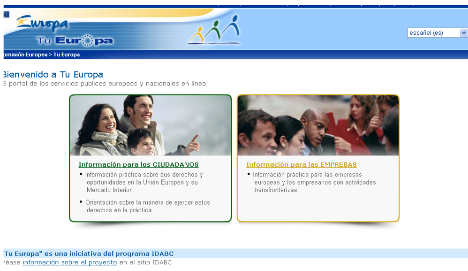
Fig. 4. Sitio web de Tu Europa / Your Europe.

Uno de los principales servicios existentes en la actualidad es Tu Europa lanzado por la Comisión Europea el 17 de febrero de 2005 e incluido en el plan de acción eEurope 2005.