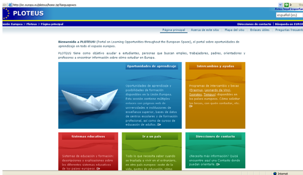
Fig. 6. Sitio web del servicio Ploteus.

Ploteus es el portal sobre las oportunidades de aprendizaje en Europa y está gestionado por la Dirección General de Educación y Cultura de la Comisión Europea.