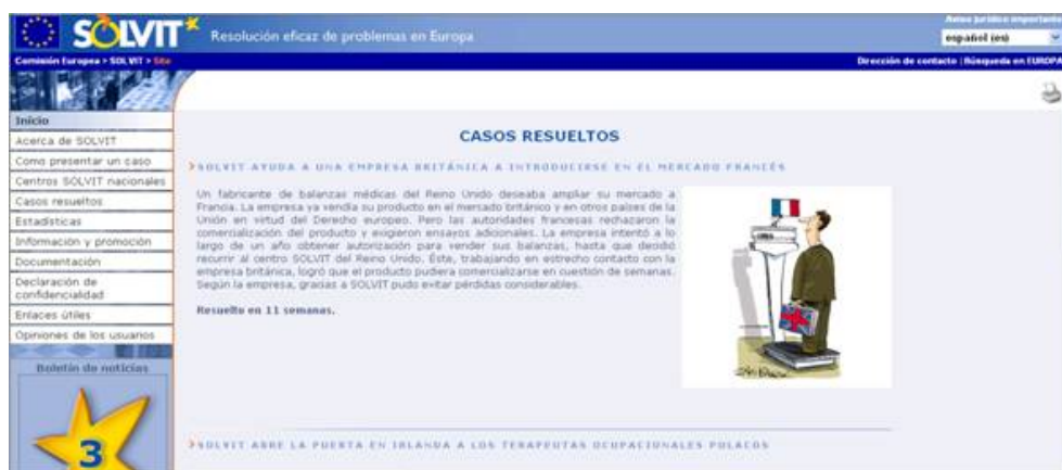
Fig. 7. Sitio web del servicio Solvit.

Solvit pretende dar respuesta a cualquier tipo de conflicto administrativo que pueda surgir tanto a los ciudadanos como a las empresas en su traslado a otro país distinto al suyo de origen: problemas en la obtención del permiso de residencia, reconocimiento de su titulación, matriculación de un vehículo, declaración de la renta, entre otros. A través de una base de datos en línea, los centros Solvit se hallan interconectados y comparten la información administrativa disponible lo que suele facilitar la resolución del problema entre aquellos centros nacionales afectados.