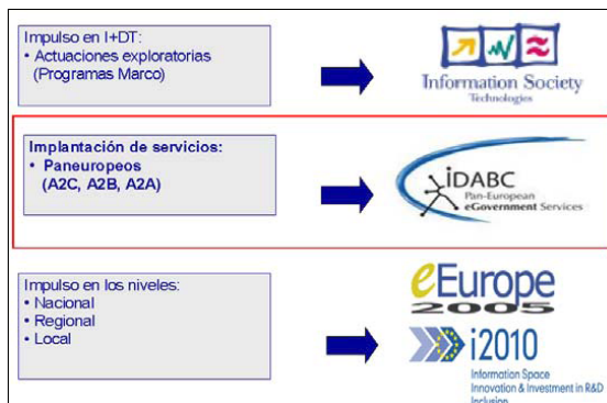
Fig. 3. Política y actuaciones de la administración electrónica en la UE.