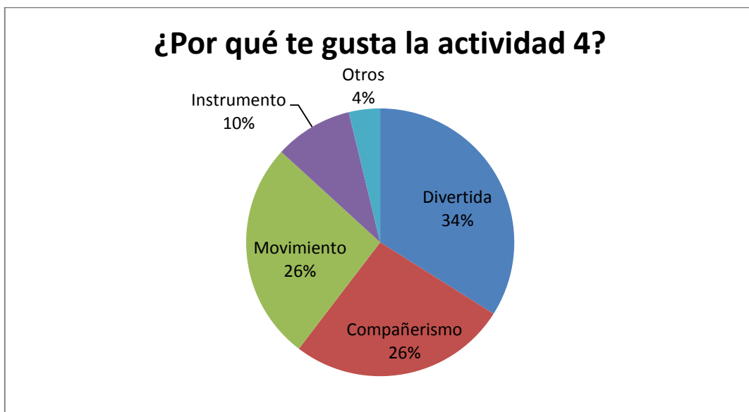
Figura 5. Encuesta.

Para encontrar las causas por las que los alumnos escogieron con tanta diferencia las actividades número 4, se analizó la segunda pregunta para encontrar las causas de este hecho y ver si correspondían con las hipótesis. Es destacable que al ser las respuestas de los alumnos tan variadas, se englobaron en 5 ítems organizados por temática en las respuestas y siendo estas: divertida, compañeros, movimiento, instrumento y otros.