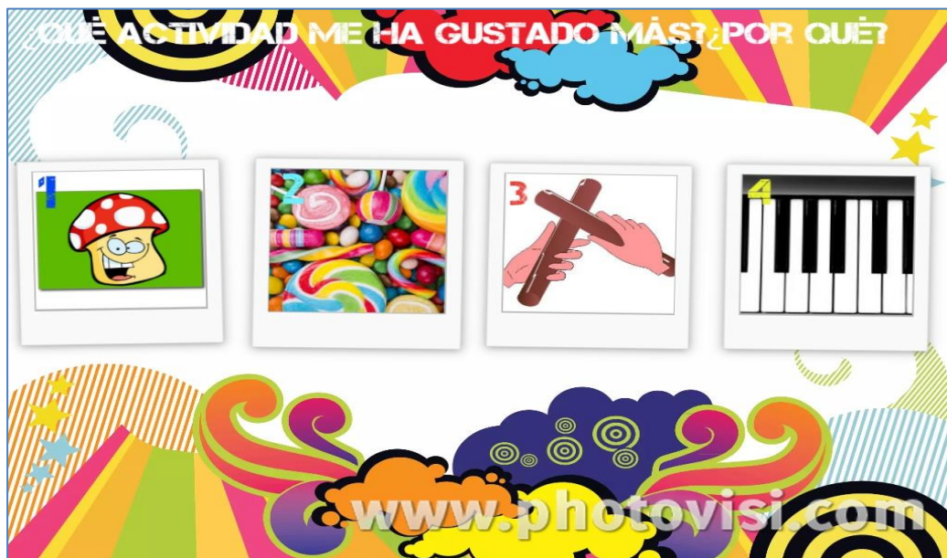
Figura 2. Imagen de actividades.

Finalmente, para que las cuatro actividades estuvieran en igualdad de condiciones, se proyectó una imagen al final de cada sesión en el que se especificaba el número de la actividad con una imagen representativa.