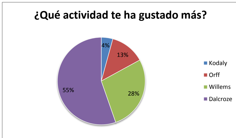
Figura 4. Encuesta.