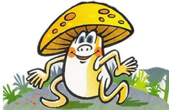
Figura 6. El bolet petitó.