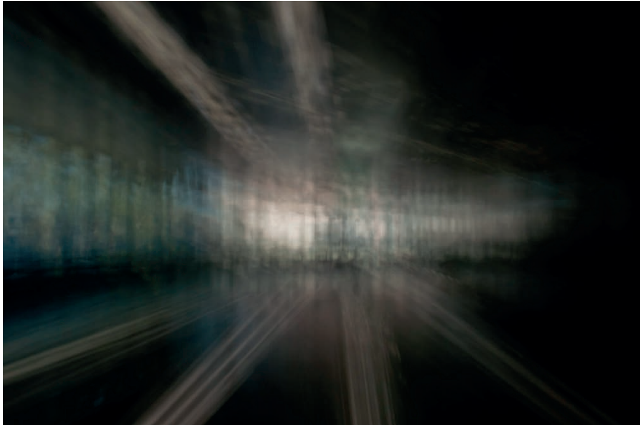
Sloth IV #7548. 2016. 70x100cm. Impresión giclée sobre papel fotográfico. Dibond de 3mm sobre bastidor de madera.