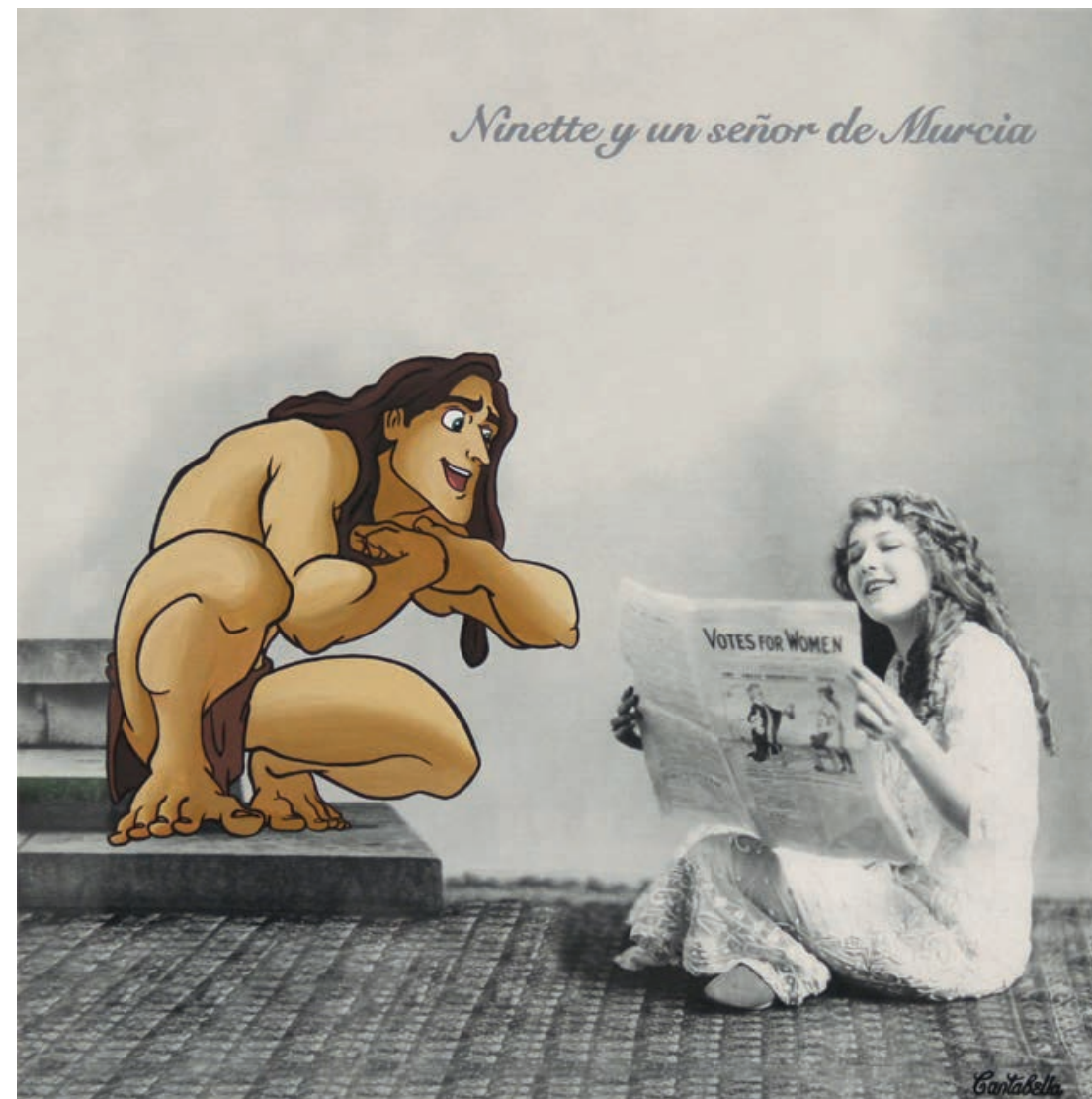
Ninette y un señor de Murcia Acrílico e impresión digital sobre lienzo 50 x 50 cm. 2019