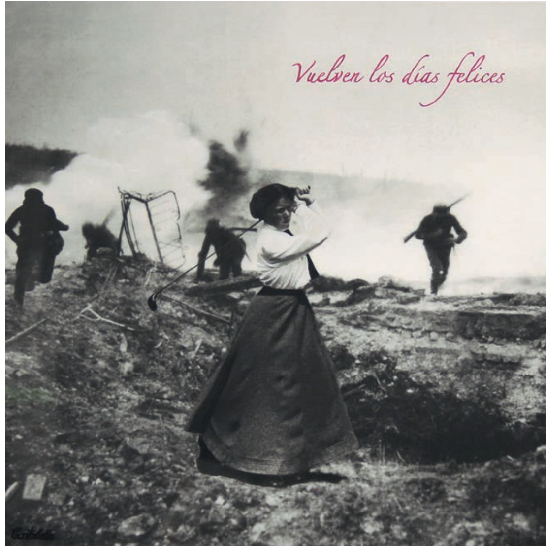
Vuelven los días felices Acrílico e impresión digital sobre lienzo 50 x 50 cm. 2019