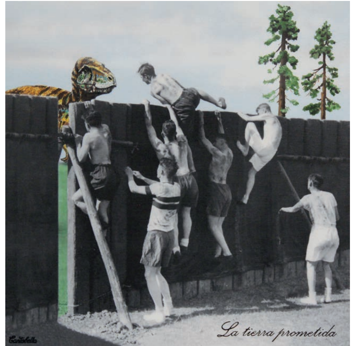
La tierra prometida Acrílico e impresión digital sobre lienzo 50 x 50 cm. 2019