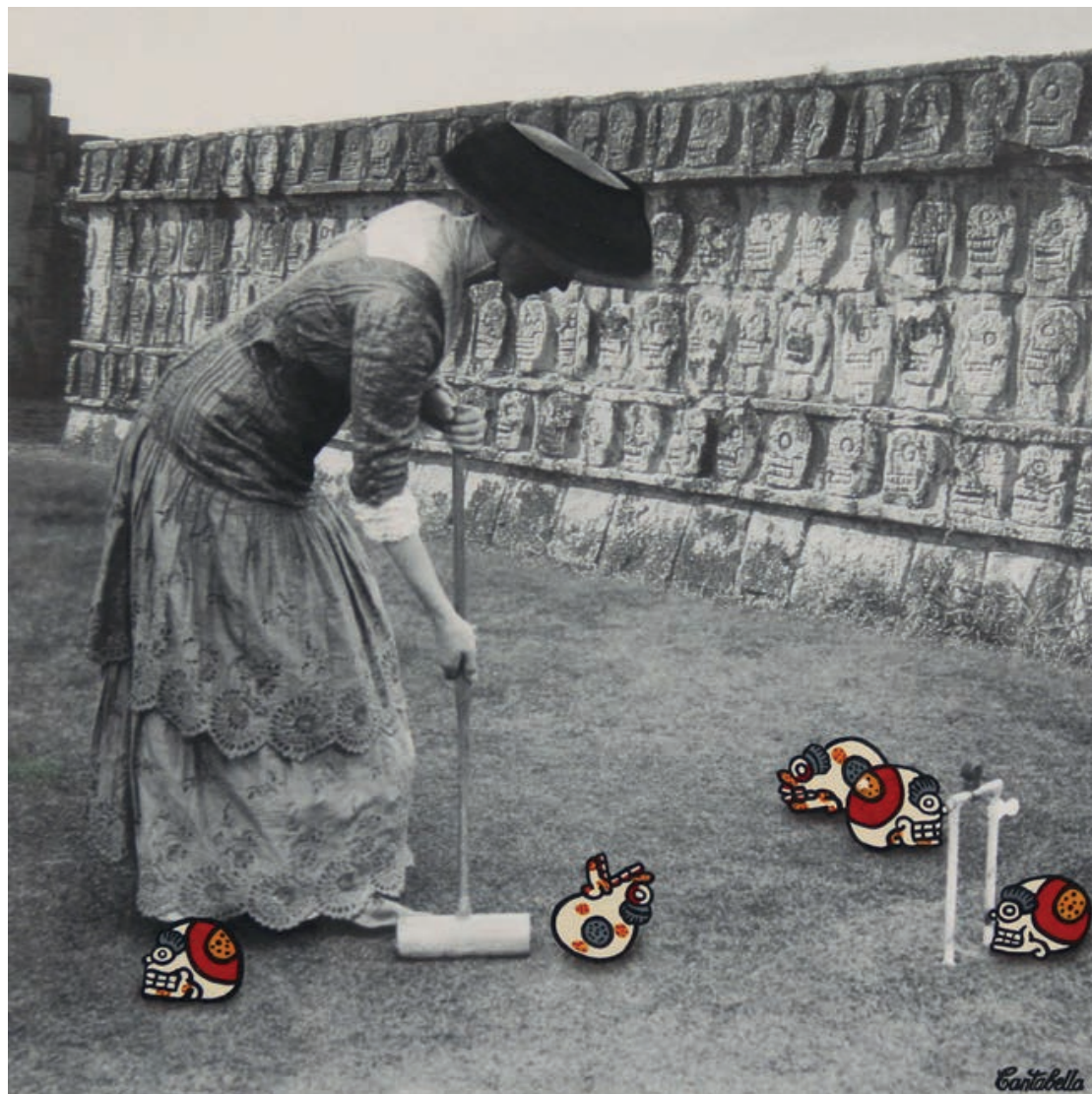
Juego de pelotas Acrílico e impresión digital sobre lienzo 50 x 50 cm. 2019