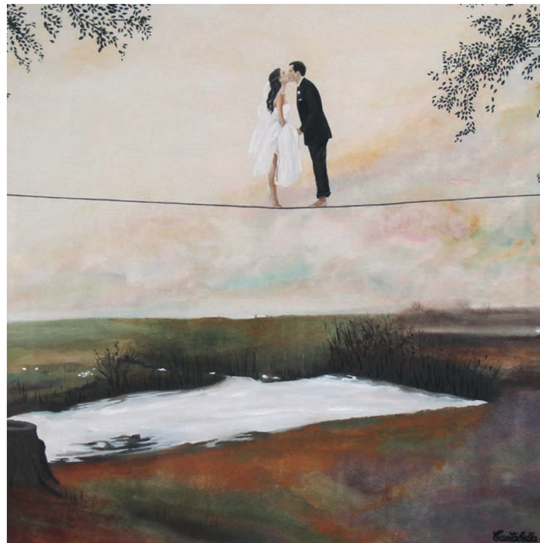
Lovers Acrílico e impresión digital sobre lienzo 50 x 50 cm. 2019