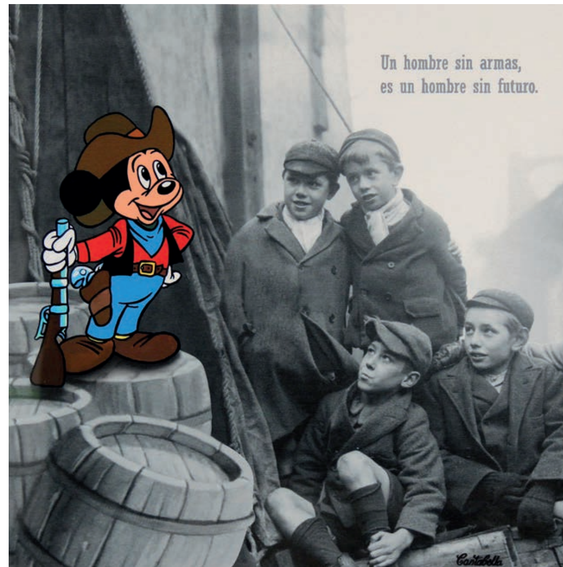
Un hombre sin armas es un hombre sin futuro. (Mickey) Acrílico e impresión digital sobre lienzo 50 x 50 cm. 2019