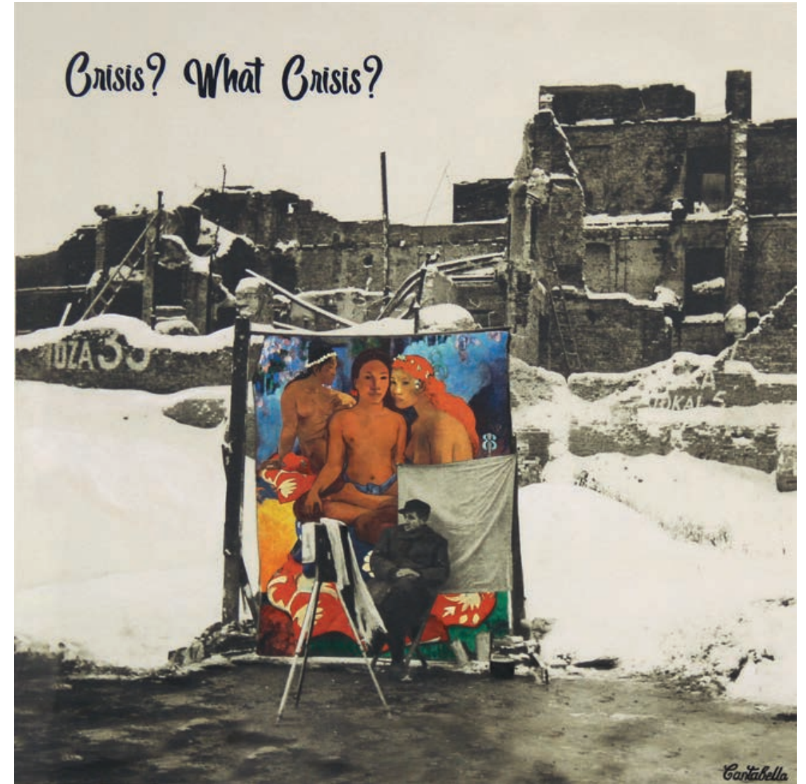
Crisis? What crisis?. (Fotógrafo) Acrílico e impresión digital sobre lienzo 50 x 50 cm. 2019