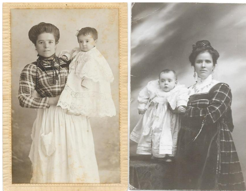
Retratos de dos amas de cría de Valencia y Murcia. Finales s.XIX

Las más solicitadas serían las mujeres de las zonas del norte del país, sobre todo de Cantabria. Hubo una gran demanda en torno a ellas, se caracterizaban por sus atuendos, tejidos, tan característicos, como vemos en las imágenes, que daría lugar al típico traje de ama-pasiega así como accesorios, collares y pendientes, Fraile (2000, p.68) todo ello denotaba el estatus de estas familias. Un ejemplo lo encontramos en ambos retratos expuestos, la primera es de un ama de Valencia y la segunda de Cartagena.