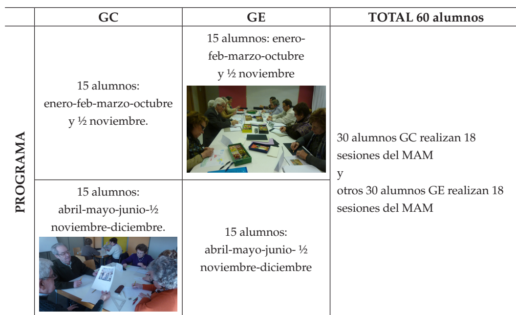
Figura 1. Programa de investigación organizado en GC y GE.

Así, hemos orientado el programa a la construcción patrimonial personal de cada alumno relacionándolo con las obras de arte seleccionadas para las sesiones considerando los procesos cognitivos y predominando la memoria cotidiana.