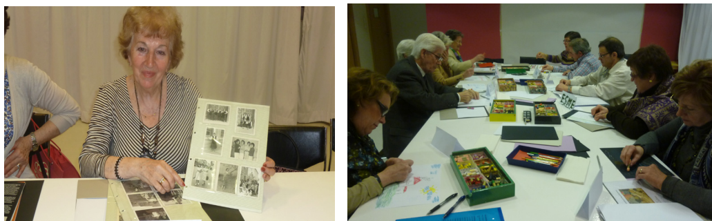
Figura 2 y 3: Alumnos en dos de las sesiones del programa: "Los mayores en el museo. Módulo de Arte y Memoria" 2011.