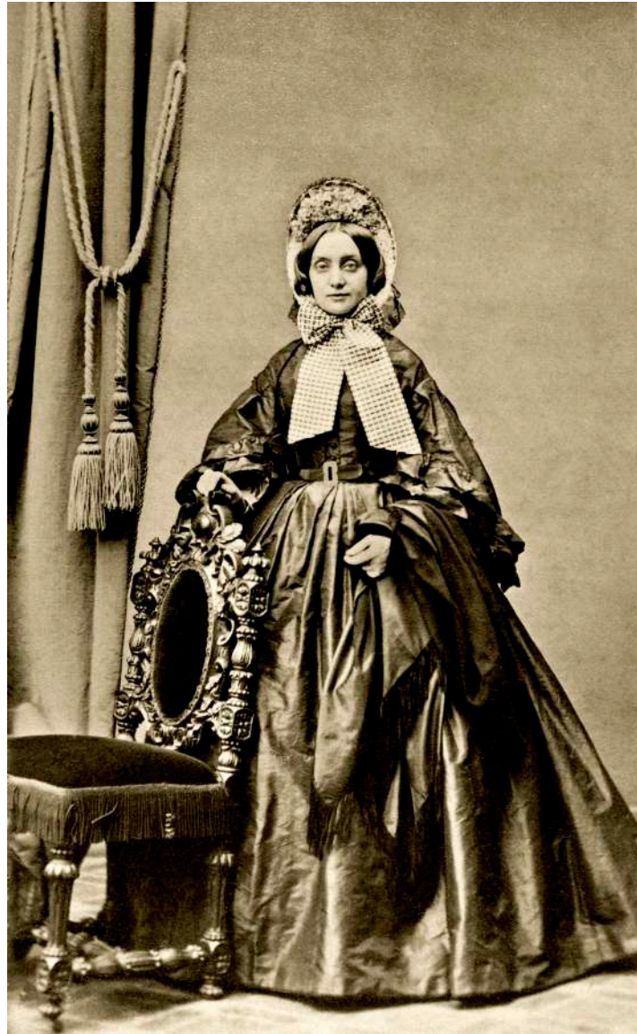
Retrato de dama con capota E. Bieber. Hamburgo, Alemania. 1869