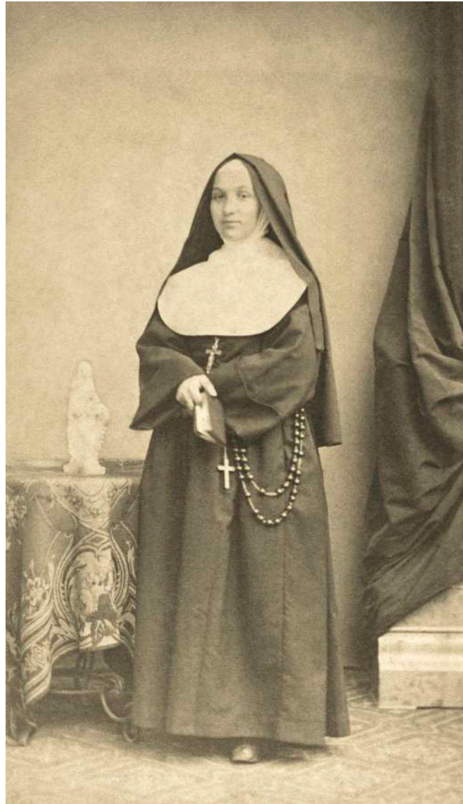
Retrato de monja L. Chamussy. Chambéry, Francia. 1883