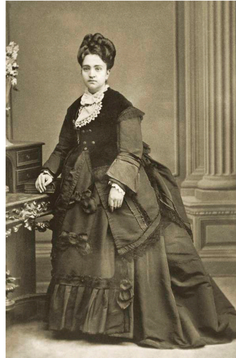
Retrato de dama apoyada sobre un buró E. Otero. Madrid, España. 1874