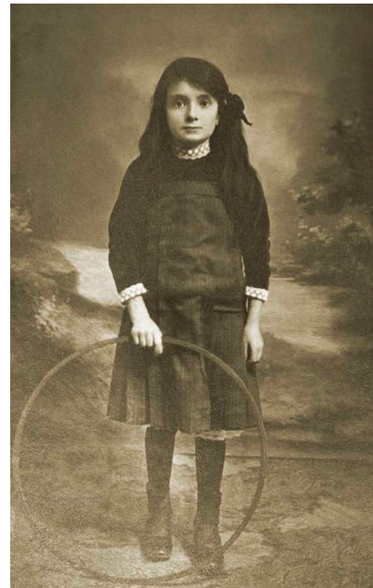
Retrato de niña con aro E. Bartoli. Lyon, Francia. 1899