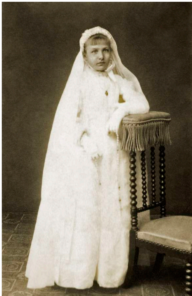
Retrato de niña de comunión J. F. Lepruiner. Bayeux, Francia. 1882