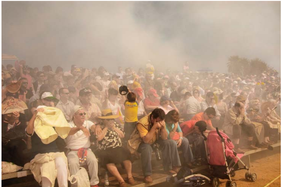
Tomás Navarro Marín El humo de la batalla Color // 60 x 90 cm