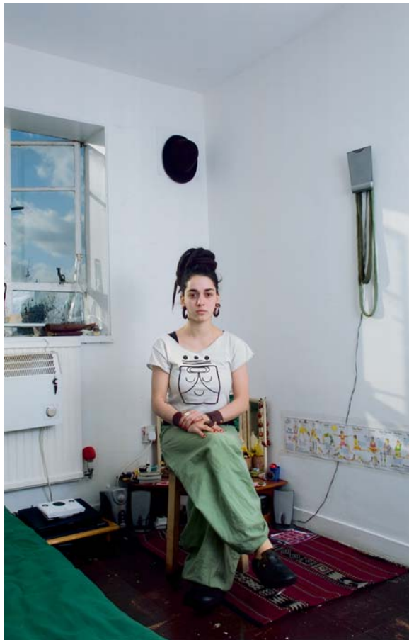
José Luis de la Parra Pérez Natalia (de la serie "Squatters") Color // 50 x 34,5 cm