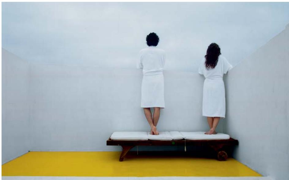
José Luis de la Parra Pérez Sin título X (de la serie "Viewers") Color // 33 x 50 cm