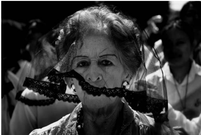
Rafael García Luján Live fast, Arizona // Procesión Puebla (serie "Tipos y retratos") B/N // 25 x 36,5 cm