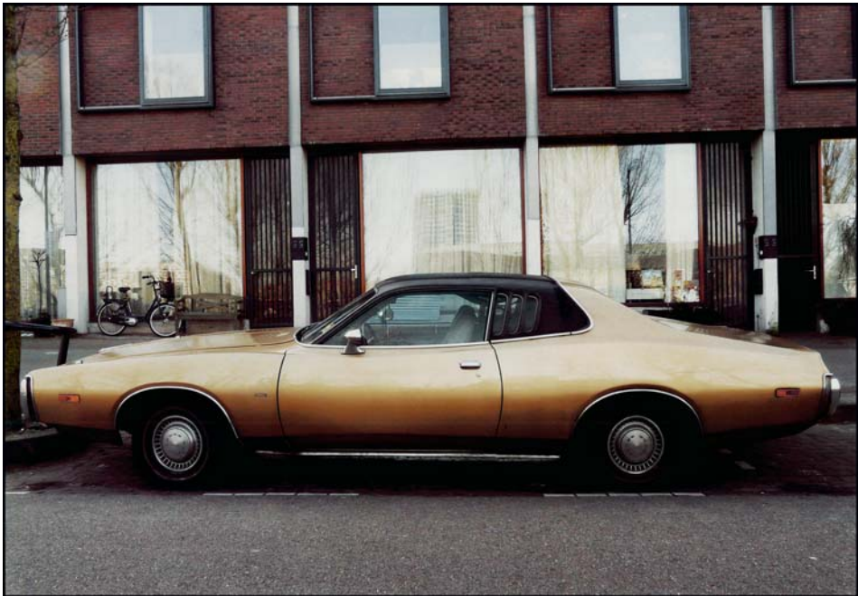
Manuel Alarcón Bisbal 1972 American life Color // 50 x 70 cm