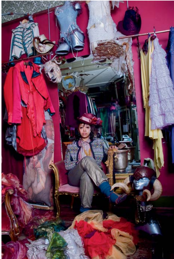
José Luis de la Parra Pérez Eve (de la serie "Squatters") Color // 50 x 36 cm