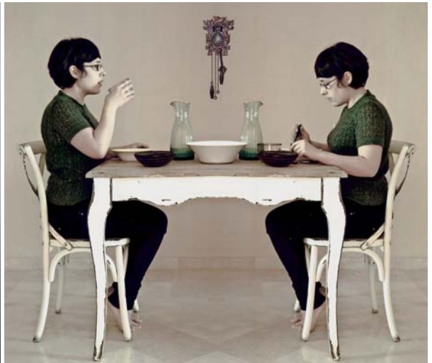
Inmaculada Cayuelas Hidalgo Hilos de Cuco I y II (díptico) Color // 31,5 x 40,5 cm