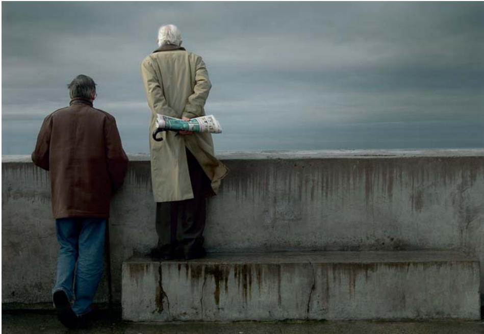
José Luis de la Parra Pérez Sin título II (de la serie "Viewers") Color // 36,5 x 50 cm