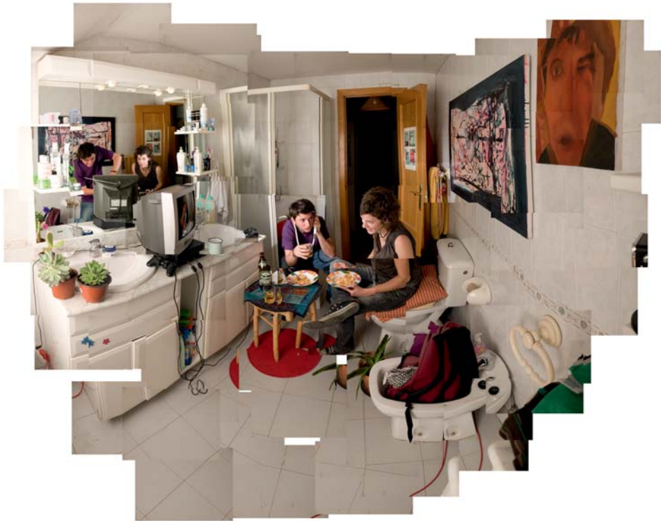
Juan García-Perrote García Bon appetit (dentro de la serie "WC")

Color. Impresión lambda sobre dm con bastidor // 90 x 100 cm