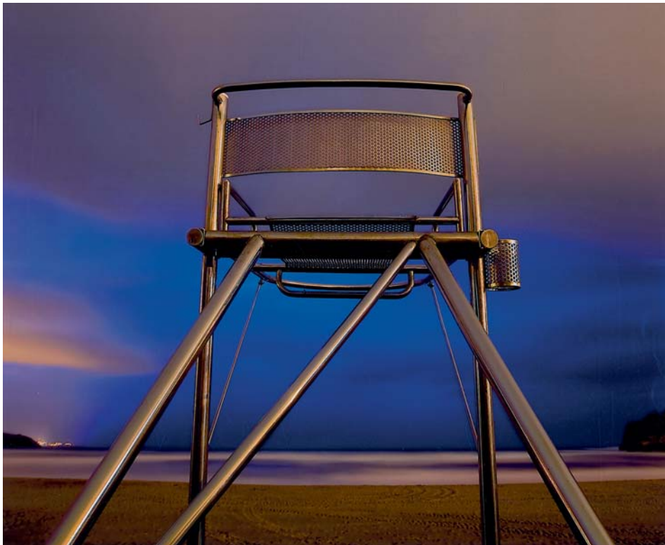
Juan Ángel Regaña Influencia del hombre sobre el paisaje natural Color // 24 x 29,5 cm