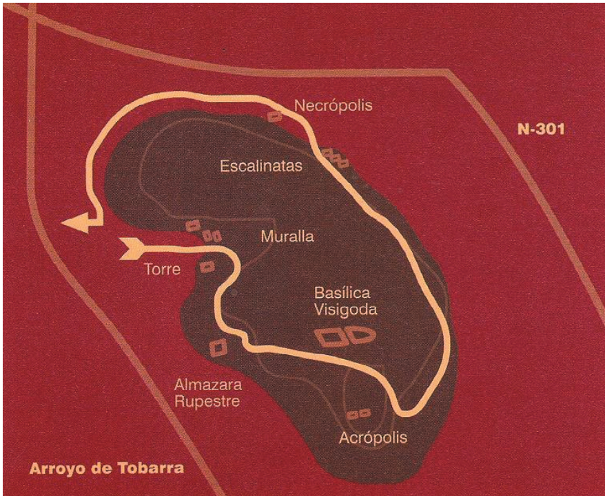
IMAGEN 1 Tolmo de Minateda (Hellín)