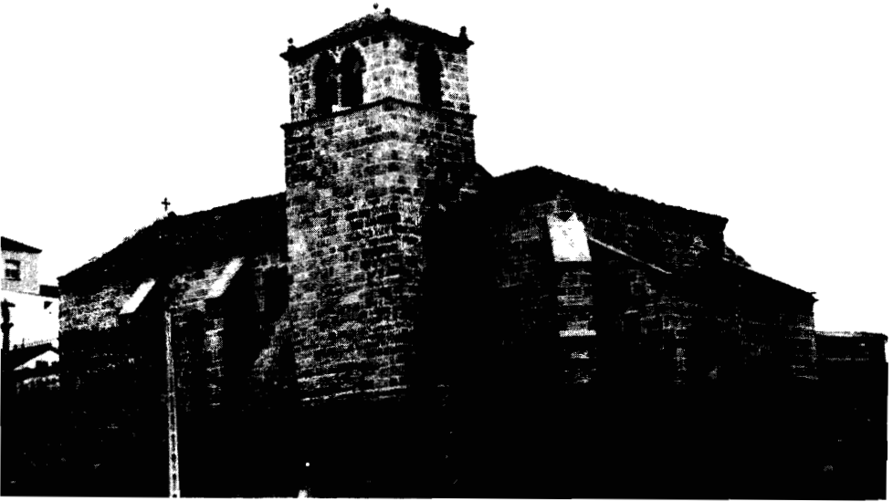
Lám. I.—Iglesia de Santa María de La Atalaya (Laxe, La Coruña).