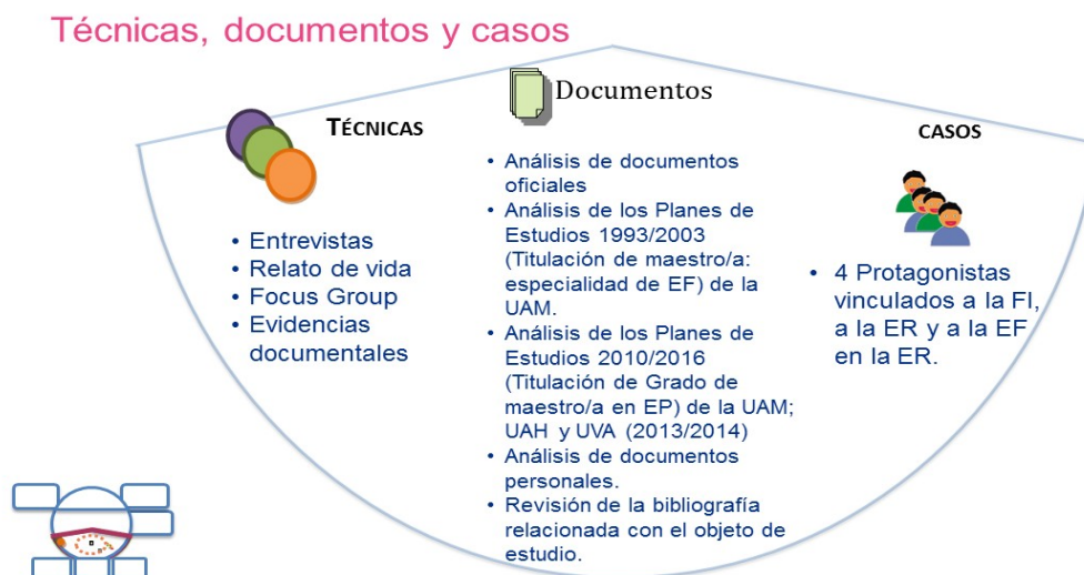
Figura 3. Técnicas, documentos y casos de la investigación.

Esta información se ha complementado con: 1) los relatos de vida de alguno de los maestros participantes; 2) documentos oficiales, personales y de la autoría de los protagonistas; 3) la realización de un grupo focal con otras personas relacionadas con la formación de docentes, sensibles a las particularidades del contexto de la ER.