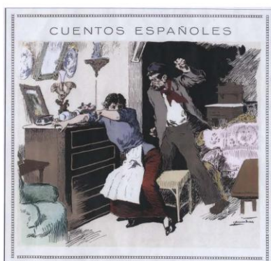
"MALTRATO" - Dibujo de Inocencio Medina Vera. (Publicado en la revista "La Esfera" en 1914)