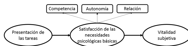
Figura 1. Representación del modelo estructural hipotetizado.

El objetivo principal de esta investigación fue estudiar, desde los planteamientos de la miniteoría de la BPNT (Deci y Ryan, 2002), las interrelaciones entre la presentación de las tareas (PT) por parte del profesor como factor social, las necesidades psicológicas básicas (NPB: autonomía, competencia y relación) como factores mediadores personales, y la vitalidad subjetiva (VS) en el contexto de la educación física. Todo esto, a través de la comprobación de un modelo teórico con la secuencia PT→NPB→VS (fig. 1), en el que se plantean las siguientes hipótesis: 1) la presentación de las tareas por parte del profesor será un predictor positivo de la satisfacción de las necesidades psicológicas básicas; 2) la satisfacción de NPB será un predictor positivo de la vitalidad subjetiva, y 3) la satisfacción de las NPB mediará la relación entre la presentación de las tareas por parte del profesor y la vitalidad subjetiva descrita por el alumno. Aunque esta relación ha sido estudiada en el contexto del deporte (e.g., Garza-Adame et al., 2017), la investigación es escasa en el contexto de la educación física, y la necesidad de su estudio ha sido puesta de manifiesto (e.g., Vlachopoulos, Katartzi y Kontou, 2011).