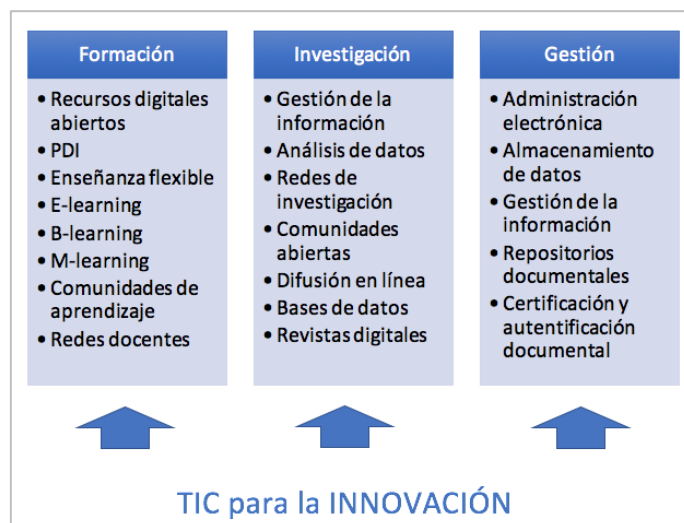
Figura 2. Innovación apoyada en TIC

Por otra parte, este enfoque organizativo de las innovaciones educativas puede responder a un modelo cerrado (aquellos procesos que se limitan a mejorar la propia organización) o a modelos abiertos (que buscan el impacto en el exterior y más allá de la organización en la cual surgen y se desarrollan). Ejemplos de este segundo caso serían las comunidades Open Course Ware en el ámbito de la enseñanza superior.