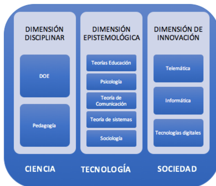
Figura 5. Las tres dimensiones de la Tecnología Educativa: docencia, investigación e innovación.

Pero además de investigar, hay que contribuir a la difusión de la investigación y a ello dedicamos nuestro esfuerzo en RIITE, revista que cada semestre recoge resultados de investigaciones en el ámbito de la Tecnología Educativa y que contribuye al esfuerzo de los investigadores noveles, quienes a menudo tan difícil encuentran el acceso al mundo de las publicaciones.