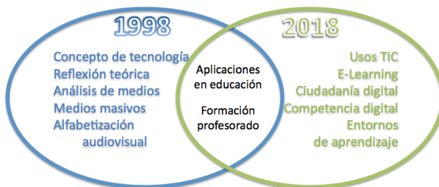
Figura 4. Evolución de la investigación en Tecnología Educativa en los últimos veinte años.

"actualmente la investigación en TE se orienta especialmente hacia el diseño de entornos que fomentan el aprendizaje con la participación-reflexión de todos los agentes implicados en contextos auténticos y con la finalidad de comprender los fenómenos y aportar soluciones a problemas reales. Por otra parte, la ética establece las bases para la práctica, constituye un enfoque desde el que desarrollar la TE e implica un compromiso individual, social y profesional" (Valverde, 2015, p. 12).