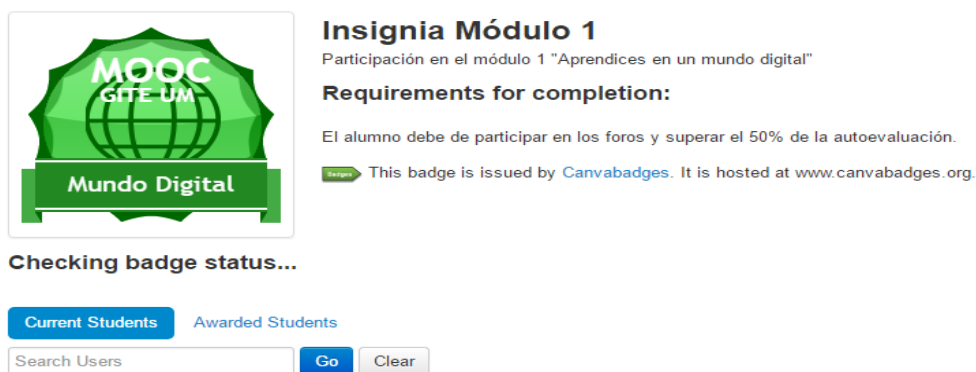
Figura 1. Badges del curso

El MOOC sigue una secuenciación lineal por módulos, correspondiéndose cada uno de ellos a una carga lectiva no superior a 3 horas. El curso cuenta con una duración de 7 semanas (del 18 de mayo al 5 de julio), siendo la última de recuperación. El MOOC está compuesto por videotutoriales de corta duración, foros asistidos por profesores, actividades prácticas en relación a los contenidos y autoevaluación tipo test de un total de 10 preguntas al final de cada módulo/semana. En cuanto a la certificación, se entregaba un diploma de superación del curso, siendo necesario para su obtención superar cada uno de los módulos a partir de criterios predefinidos (visionado de páginas, aportes en los foros y superación del mínimo establecido en las evaluaciones). A su vez, en cada uno de los módulos se daban a los participantes unas medallas (Badges).