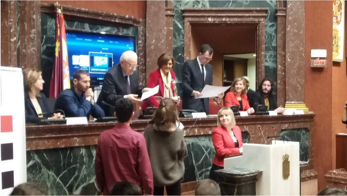
Presidente del CTRM y Alcalde de Murcia entregan 1er premio video.