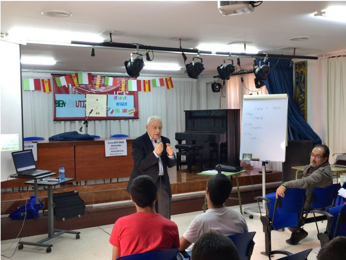
Charla en IES Saavedra Fajardo de Murcia