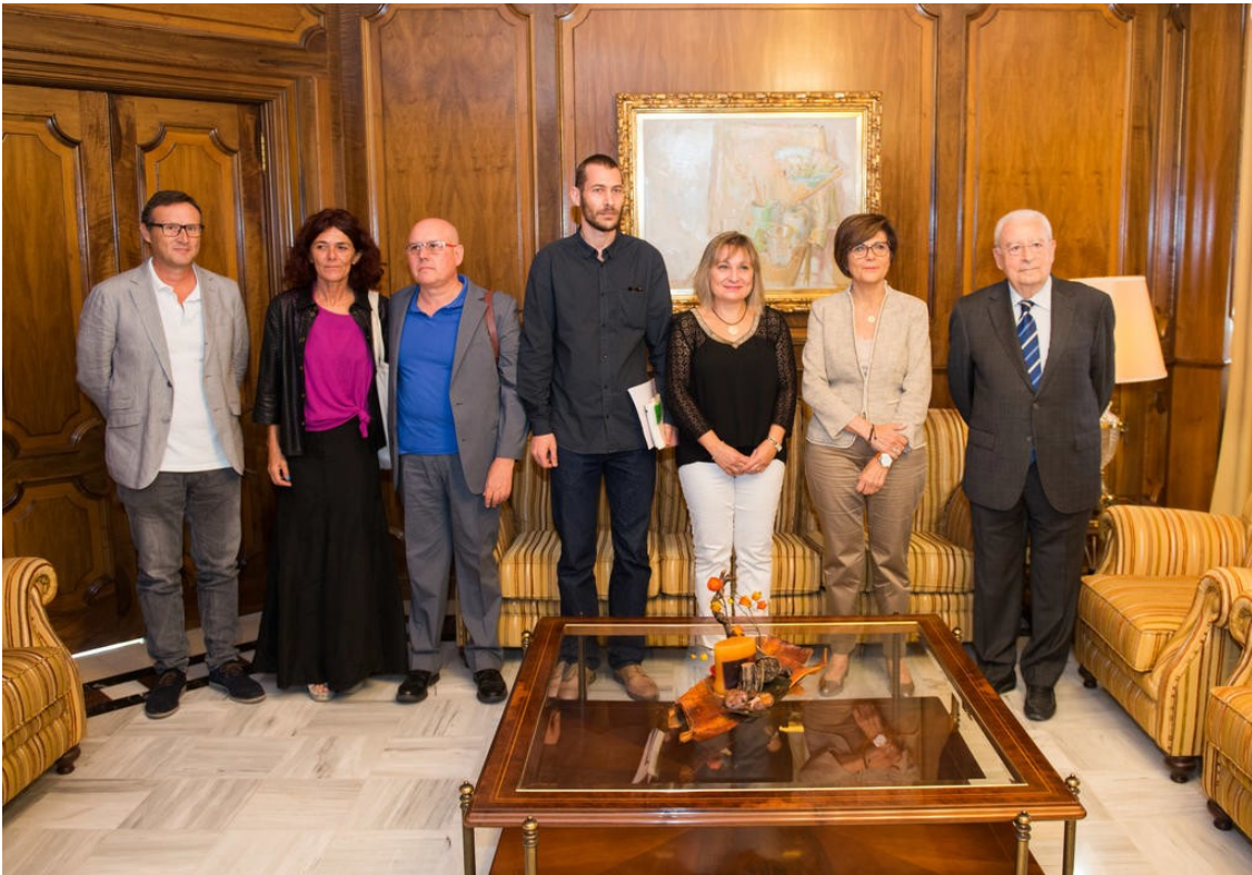
Visita a la Asamblea Regional para presentar el proyecto.