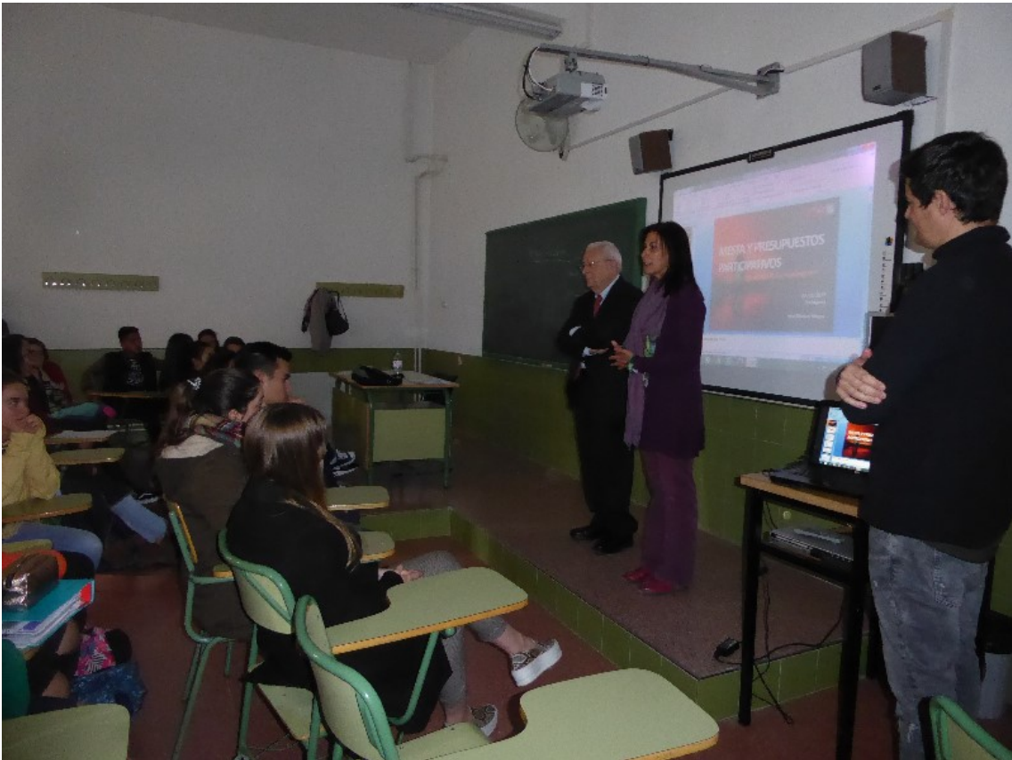
Charla en IES Jiménez de la Espada de Cartagena.