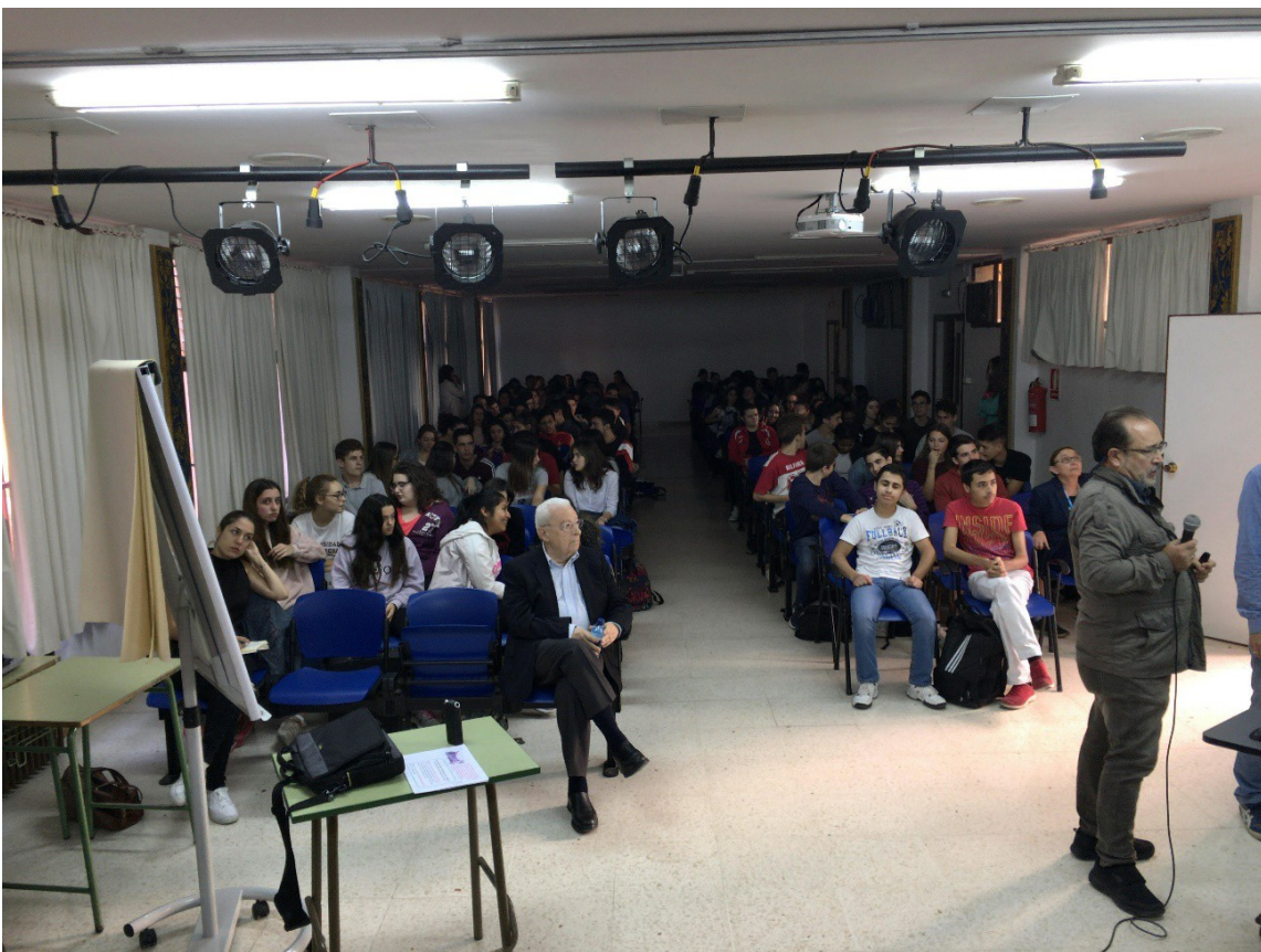
Charla en IES Saavedra Fajardo de Murcia.