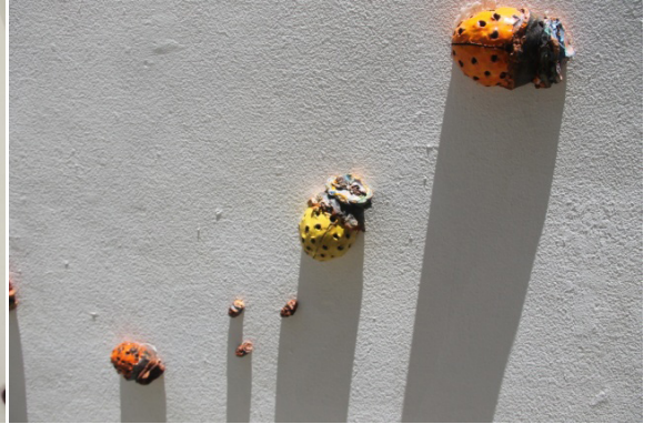
Fig. 17, 18 y 19. Buscando el Sol . Instalación. Cerámica modelada y esmaltada. 2017. Museo de Arte Moderno. Santo Domingo.