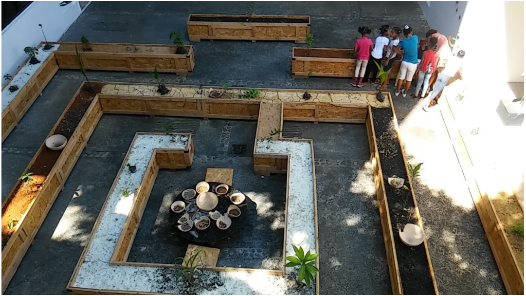
Fig.16. Laberinto , de la serie Tiempos de Siembra . Instalación interactiva. Materiales: Madera, tierra, semillas y plantas. Patio del Museo de Arte Moderno. Santo Domingo.