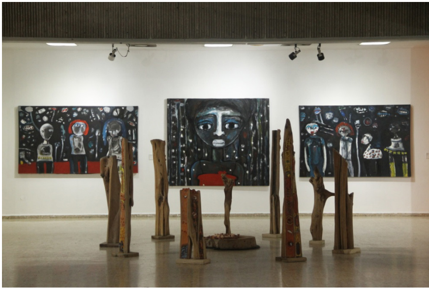
Fig. 24. Vista de obras de la exhibición Anatomía del Ser . Museo de Arte Moderno. Santo Domingo