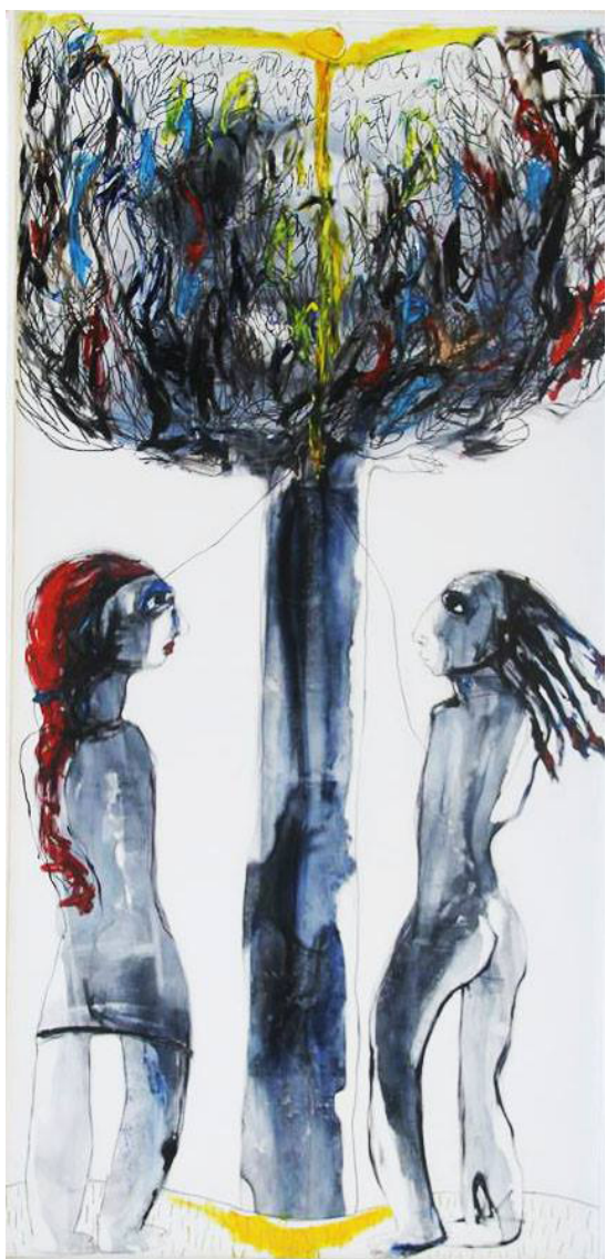
Fig. 22. Conexión Vital 1 . Óleo sobre formica, 96 x 48 pulg. 2017 Fig. 23. Conexión Vital 2 . Óleo sobre formica, 96 x 48 pulg. 2017