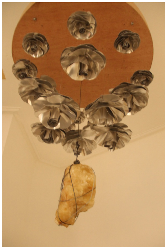
Fig. 21. Agua Sana . Instalación. Aluminio, piedra, arcilla blanca y agua de mar. 2016, medidas variables. Museo de Arte Moderno. Santo Domingo.