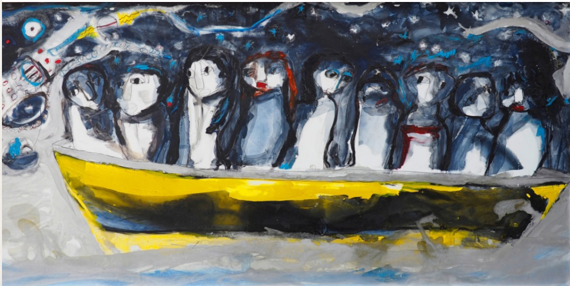
Fig. 2. Viaje Cósmico , Óleo sobre formica, 122 x 244 cm, 2017. Autora: Iris Pérez Romero