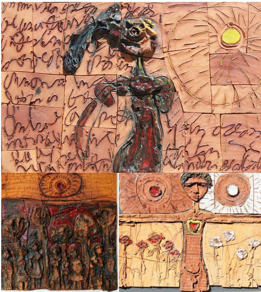
Fig. 11. En mi Isla estoy , cerámica modelada y esmaltada, 45" x 30", 2015.

Autora: Iris Pérez Romero, fotografía: Antonio Canela Ruano.