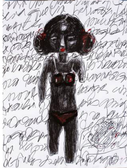
Fig.10. De la serie Grooming , mixta sobre papel , 40 x 26 pulg, 2013

Reflexión sobre la violencia a la que están siendo expuestos niños, niñas y adolescentes, tanto en las escuelas, en los hogares, la sociedad que los rodea y las plataformas creadas a través de las redes tecnológicas.