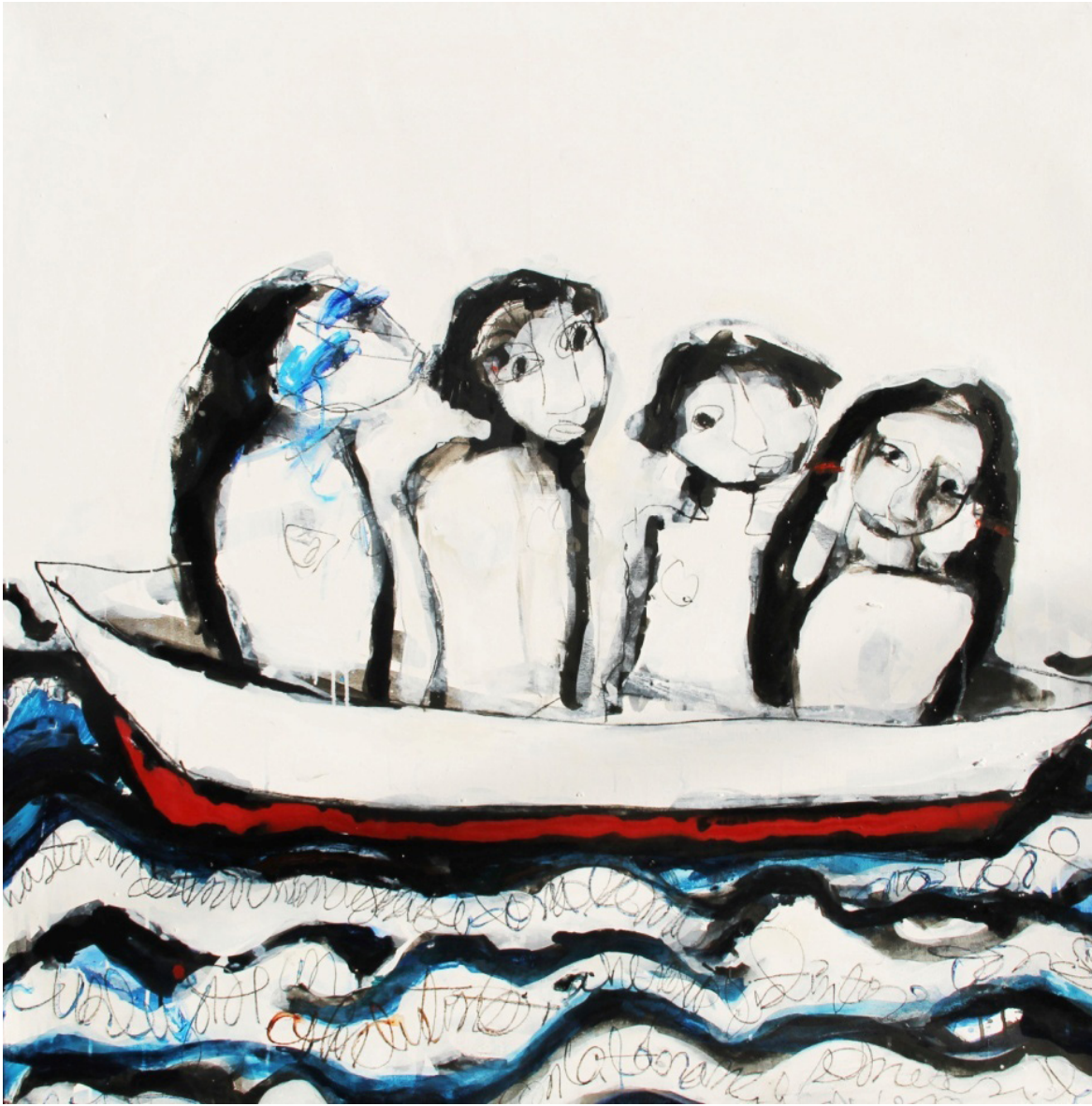
Fig. 1. Los Caminos del Ser . Acrilica sobre tela. 122 x 122 cm., 2016.