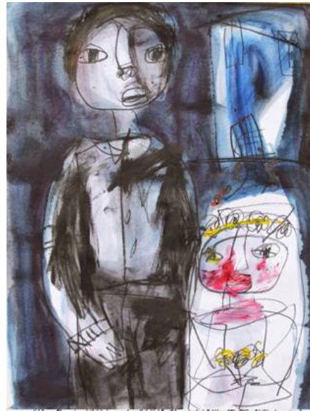
Fig.9. Bride Child , mixta sobre papel 13 x 18, 2015