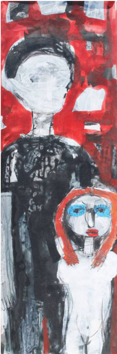
Fig. 8. Acosada , 2014, acrílica sobre tela, 13 x 24 pulg, 2015