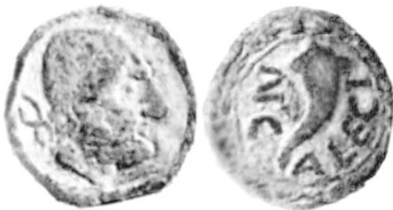
Fig. 3: Imagen retocada para mayor claridad, original de García-Bellido, 1986, p. 44, (G1).