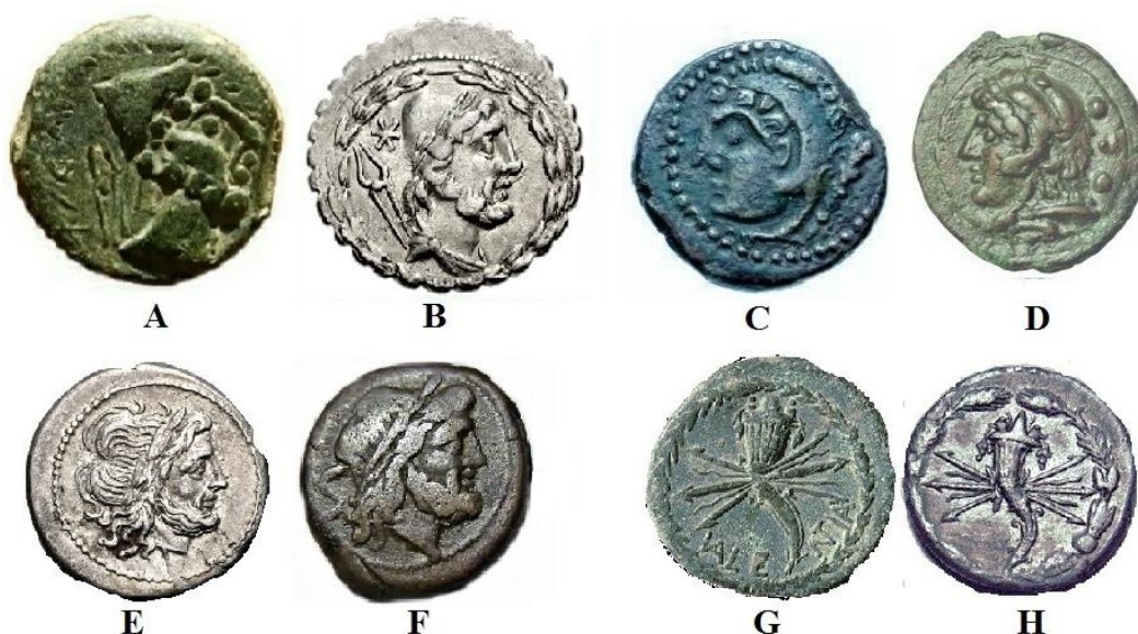
Fig. 6:

Para los anversos encontramos numerosos modelos similares en acuñaciones romanas o hispanas del siglo III al I a. C. En la pieza de módulo mayor, G, se representa a Vulcano con barba, cubierto con pileo y con unas tenazas detrás. Este diseño también fue utilizado en varios plomos monetiformes de la serie de la minas (números 17, 18, 20, 21 y 22) 7 . Como modelo pudieron emplearse los numerosos ases de Malaka emitidos entre c.175/150 -100/91 a.C. (fig. 6A.); o el denario de L. AVRELIVS COTTA (fig. 6B) datado en 105 a. C y, probablemente, casi coetáneo con las acuñaciones estudiadas. También fue empleado en acuñaciones de Ebussus.