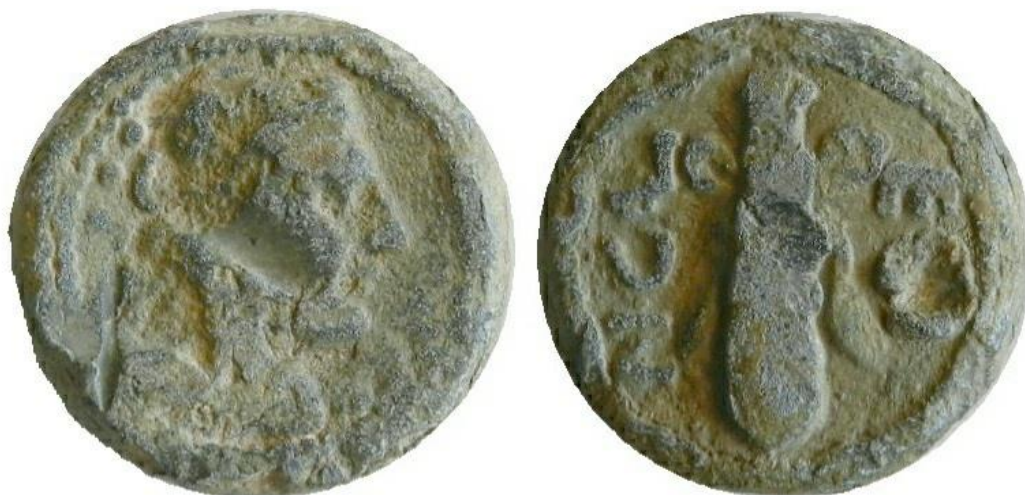
Fig. 4: Colección privada (M2).

Reverso: Cornucopia dentro de orla linear rodeada de láurea. Alrededor leyenda levógira: N · C / ALECI.