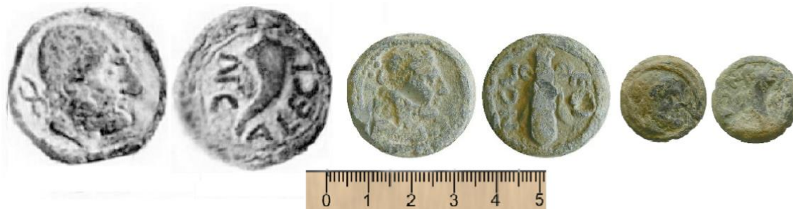
Fig. 1: Serie plomos monetiformes N. CALECI. De izquierda a derecha: módulo grande (G), mediano (M) y pequeño (P).