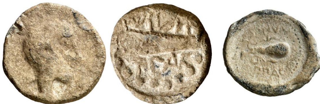
Fig. 7:

(post. 127- ante.75 a.C.) y en el denario de Q. FABIO MAXIMO datado en 127 a.C. (fig. 6G y H, respectivamente).