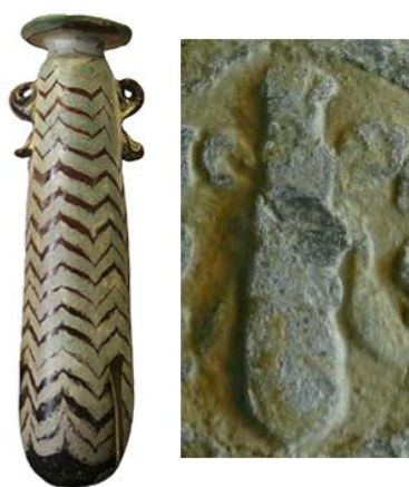
Fig. 8: Alabastrom (Museo Arqueológico de Nápoles) y detalle reverso tipo M.

Para el otro elemento grabado en el cuadrans de módulo mediano se han formulado distintas hipótesis. Podría tratarse de una clava, simbología concordante con el anverso de Hércules, como en el cuadrans de L. OPEIMI (ca. 125 a. C.); o también representar una bellota, en el sentido de simbolizar la riqueza, como sucede en las acuñaciones de Ostvr. En ambos casos con un cinta con lazo. Otra posibilidad es que se trate de una bolsa cerrada con un lazo, también en el sentido de riqueza; en este trabajo se propone una cuarta posibilidad. Existen antecedentes o, al menos, paralelismos en unos plomos monetiformes hallados en Mallorca 8 , que podrían ser similares a los procedentes del pecio de las Amoladeras, actualmente en el Museo Nacional de Arqueología Subacuática de Cartagena 9 ; donde el elemento grabado en el reverso es semejante al nuestro (Fig. 7, izda. y ctro.). En otro plomo de la misma procedencia, el elemento aparenta ser un recipiente (ungüentario de vidrio) cerrado por un tapón con dos "antenas" de las que cuelgan sendas cintas (Fig. 7, dcha.).