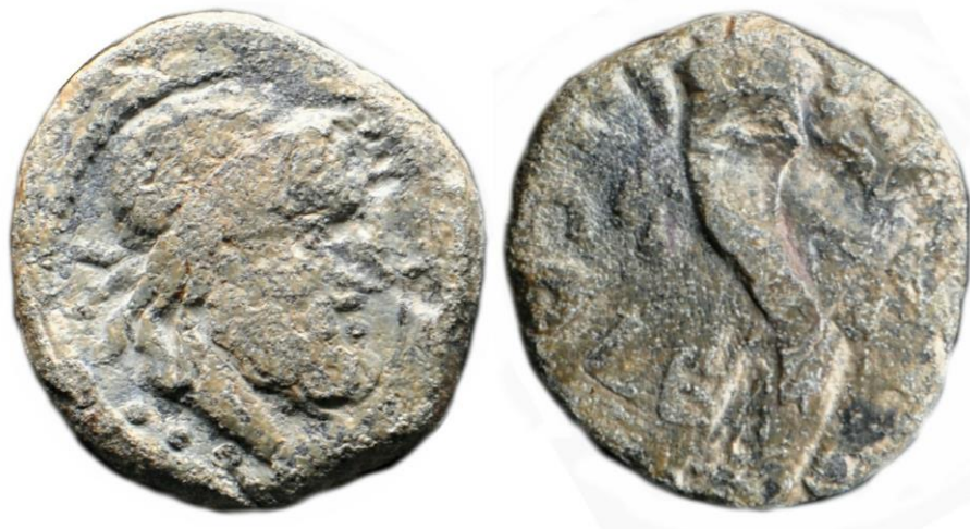
Fig. 5: (P2).

Reverso: Ungüentario (ver discusión más adelante) con cinta y lazo. Leyenda recta dextrógira: N · CAL (A y L enlazadas) / ECI . Borde resaltado.