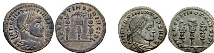
Follis de Constantino I (RIC VI 351a) y de Maximino Daya (RIC VI 350b).