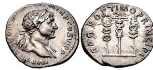
Denario de Trajano (RIC II 295).

Otras amonedaciones que copiaron el reverso de la serie legionaria de Marco Antonio fueron acuñadas por los postreros emperadores Clodio Albino (193 d.C.), Septimio Severo (193-211 d.C.), Caracalla (198-217 d.C.), Heliogábalo (218-219 d.C.), Galieno (253-268 d.C.), Constantino I, el Grande (303-337 d.C.), Maximino Daya (310-313 d.C.), Licinio I (308-324 d.C.) y Alejandro de Cartago (308-311 d.C.).