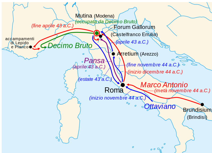
Movimiento de las legiones durante la guerra de Mutina (44-43 a.C.).