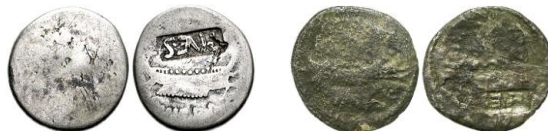
Denarios contramarcados de Marco Antonio en época de Vespasiano, en Éfeso, durante los años 74-79 d.C. 72

Posteriormente, encontramos estas monedas contramarcadas en tiempos de Vespasiano (69-79 d.C.) 68 , y si bien Trajano (98-117 d.C.) retiró de la circulación los denarios de época republicana, por demasiado pesados (de hecho, todos aquellos acuñados antes de la reforma de Nerón), mantuvo en vigor la serie “legionaria” de Marco Antonio 69 : éstas monedas no fueron objeto de una “restauración” simplemente por el hecho de que seguían en el circulante. Unos cien años después, aparentemente con objeto de celebrar el bicentenario de la batalla de Actium , Marco Aurelio (161-180 d.C.) y Lucio Vero (161-168 d.C.) restauraron los tipos legionarios de Marco Antonio en una remarcable emisión de denarios, años 168-169 d.C. 70 , en concreto, la LEG VI 71 .