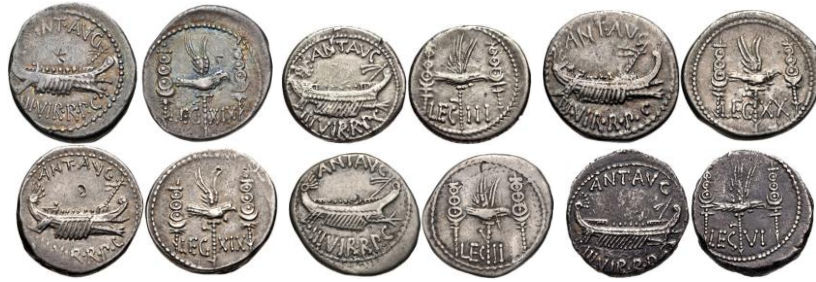
Diversas formas de las letras de las leyendas de los denarios legionarios de Marco Antonio.

Esta serie fue emitida entre el otoño del año 32 a.C. y la primavera del año 31 a.C. 12 , quizás en la ciudad y puerto aqueo de Patras 13 , en el norte del Peloponeso (periferia de Grecia Occidental), la base de operaciones de Marco Antonio, ya que haberlo efectuado en Actium era muy arriesgado. La uniformidad de tipo y estructura denota que su producción parece haber sido reducida (en principio) a una única área 14 . Evidentemente, la producción fue efectuada antes del enfrentamiento decisivo entre ambos bandos 15 .