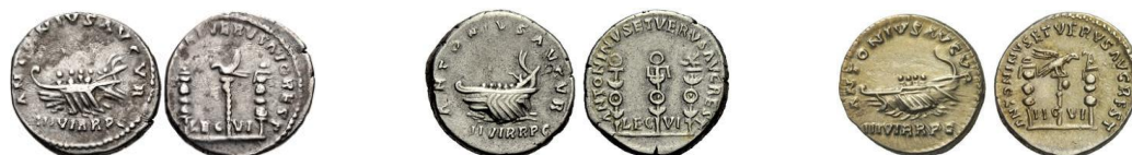
Denarios de Marco Aurelio y Lucio Vero (RIC III 443).

Esta tipología siguió siendo popular aún sin celebrar ocasiones conmemorativas. Fue un pilar de los cistóforos imperiales en Asia Menor, y los tres emperadores flavios acuñaron bronce medios con la tipología del reverso inspirada por este diseño. Trajano (98-117 d.C.) la utilizó para las monedas de todos los metales. Cuadrantes “anónimos” con esta tipología fueron también acuñados, así como por parte de Adriano (117-138 d.C.) (cuya emisión de ca. el año 118 d.C. puede conmemorar el 150 aniversario de Actium ) y Antonino Pío (138-161 d.C.).