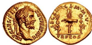
Áureo de Septimio Severo (RIC IV 14).

Otras amonedaciones que copiaron el reverso de la serie legionaria de Marco Antonio fueron acuñadas por los postreros emperadores Clodio Albino (193 d.C.), Septimio Severo (193-211 d.C.), Caracalla (198-217 d.C.), Heliogábalo (218-219 d.C.), Galieno (253-268 d.C.), Constantino I, el Grande (303-337 d.C.), Maximino Daya (310-313 d.C.), Licinio I (308-324 d.C.) y Alejandro de Cartago (308-311 d.C.).