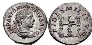
Denario de Heliogábalo (RIC IV 78).