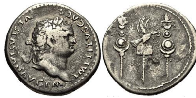
Tetradracma cistofórico de Tito (RIC II 516 = RPC II 861).