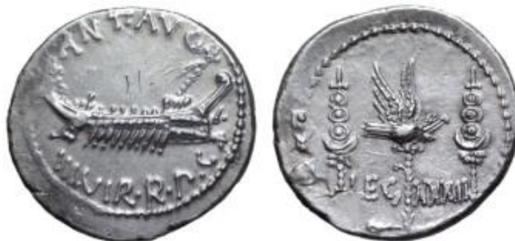
Moneda con la legio XXXIII ampliada.

momento 19 . Este es un caso diferente, ya que se documenta por primera vez una legión totalmente desconocida y que abre de nuevo el debate sobre la composición del ejército del famoso triunviro.