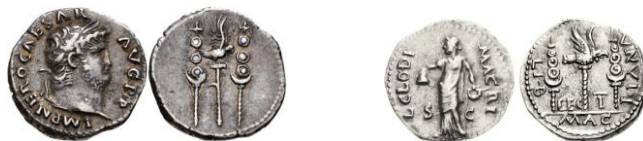
Denarios de Nerón (RIC I 68) y de Clodio Mácer (RIC I 20).

d.C.) 67 y por algunos que acuñaron las monedas anónimas que se denominan “de las Guerras Civiles”.