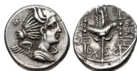
Denario de C. Valerio Flaco emitido en Massalia (RRC 365/1a).

Marco Antonio comenzó la presente emisión de monedas en el año 32 a.C., justamente 50 años después de que el imperator C. Valerio Flaco ( cos. 93 a.C.) produjera una emisión de denarios (RRC 365/1) con un diseño de reverso que muchos investigadores piensan que fue el prototipo del icónico diseño del reverso de esta serie 64 . Esta tipología, que presenta un águila legionaria entre dos estandartes legionarios, fue posteriormente reciclada en varias ocasiones. La presente serie permaneció en circulación durante muchas décadas, hasta la época de los Severos 65 , teniendo una gran popularidad, como lo muestra el hecho de que fue imitada por diversos emperadores 66 .