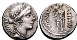
Denario RRC 442/1b