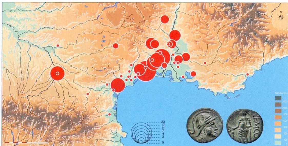
Distribución de los pequeños bronce de Nîmes con leyenda NEM-COL (tipo NIM-2735) (Según M. Feugère y M. Py).

señalan en la parte inferior del valle del Ródano, así como en Ensérune y Vieille-Toulouse 35 .