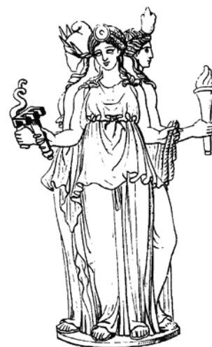
ILUSTRACIÓN DE STÉPHANE MALLARMÉ (1879)

En este número, presentamos diecinueve trabajos de investigación, no sólo de numismáticos e historiadores españoles, sino que como ya es de costumbre, la revista se nutre de la participación de colegas internacionales. A continuación, brindamos un escueto comentario introductorio de cada uno de estos artículos.