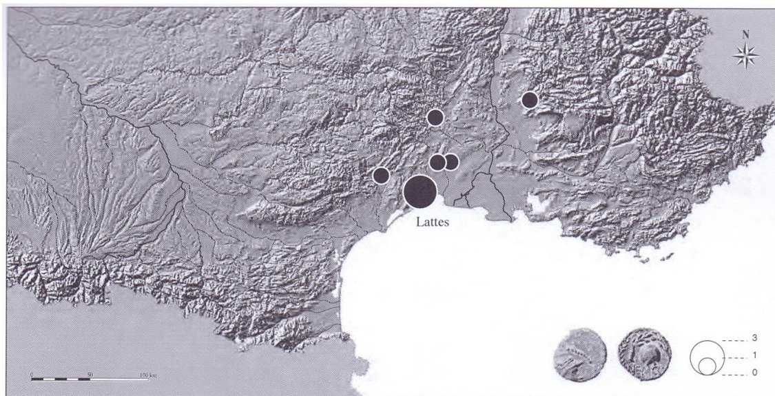
Mapa de distribución de los pequeños bronce de Nîmes NEM-COL «à l'urne renversé» (Tipo NIM 2725. Según M. Py).

La cabeza del anverso es similar a la de las dos series anteriores, lo que acentúa la homogeneidad del grupo de monedas con la leyenda NEM-COL que generalmente se considera como integrantes de una misma serie monetar. El motivo del reverso, generalmente identificado con una urna volcada evocando la fuente de Nemausus , ha sido recientemente objeto de diferentes interpretaciones, como un aríbalo 40 o como una ventosa que simboliza el papel de tipo federal del santuario sanador de La Fontaine 41 , ubicado al pie del Monte Cavalier, origen mismo de Nîmes.