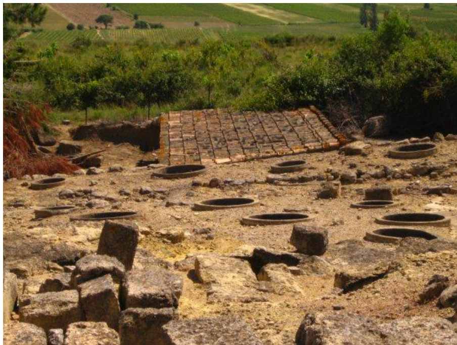
Vista de 72 silos de grano del oppidum de Ensérune.

dominante, aunque falta confirmación 37 . L. Villaronga había situado este taller al este del río Hérault 38 , cuando Ensérune se encuentra al oeste de este accidente geográfico.