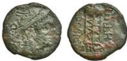
Bronce ACIP 2678 = CNH 2.

Muy posiblemente, la aparición de esta amonedación, como la de otros grandes bronce ibero-languedocianos, obedezca a la política de Roma de premiar a aquellas comunidades o dinastas que habían apoyado a ésta durante la conquista de la Galia Transalpina 58 , y/o parcelar los grandes grupos étnicos con objeto de controlar mejor el territorio.