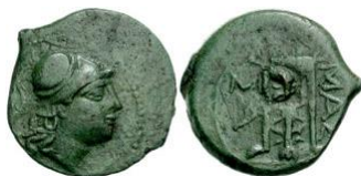
Bronce de Massalia (SNG Copenhagen 740), ca. finales del siglo III a.C.

Sin embargo, según M. Py, como ya se ha sostenido desde hace tiempo, el tema del trípedo (¿y el módulo de estas piezas?) podrían haberse inspirado de manera directa de los grandes bronce de Massalia de la serie Depeyrot Massalia 23-27 = tipos GBM-23/27 de M. Feugère y M. Py, cuya acuñación se inició en las últimas décadas del siglo III a.C. y que no se prolongan más allá del primer tercio del siglo II a.C. Este paralelo, difícil de cuestionar, podría justificar una datación alta para las monedas de los Longostaletes, siquiera para las primeras emisiones 53 .