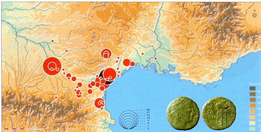
Mapa de distribución de las monedas de Longostaletes (según M. Feugère y M. Py).

un gran número en Vieille-Toulouse y Narbona 44 . Se ha supuesto la existencia de imitaciones locales en Narbona, lo que M. Py duda 45 .