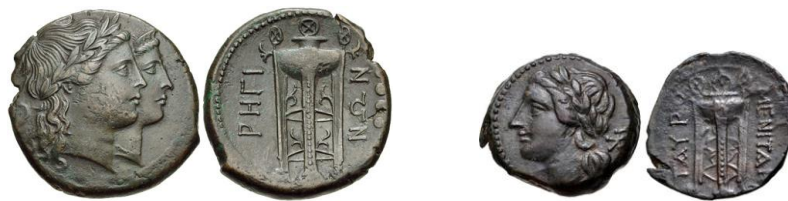
Triente de Rhegion (NH Italy 2550), ca. 250-150 a.C. y bronce de Tauromenion (HGC 2 1587), ca. 336-317 a.C. respectivamente

Las monedas de los Longostaletes se distribuyen bastante ampliamente alrededor de la región de Narbona-Béziers, considerada desde hace tiempo como la localización probable de este pueblo 27 .