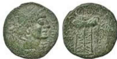
Bronce ACIP 2680 = CNH 4.

Tradicionalmente se ha considerado que los Longostaletes eran un pueblo que habitaba los actuales departamentos franceses de Hérault y Aude 1 , aunque sobre su ubicación, vid infra . La serie con leyenda griega Λονγοσταλετον es, entre los grandes bronzes ibero-languedocianos, los más helenizados 2 , como muestra la cabeza de Hermes en el anverso y la utilización del griego en sus epígrafes (aunque en alguna de las series también se utiliza el silabario ibérico).