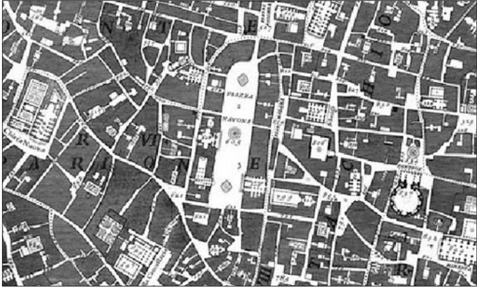
Figura 1 FRAGMENTO DEL MAPA DE ROMA DE NOLLI, 1748