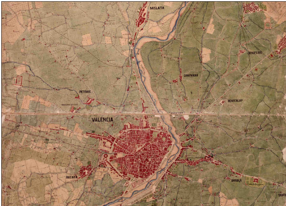
Figura 2 FRAGMENTO DEL PLANO DE VALENCIA Y SUS ALREDEDORES. CUERPO DE ESTADO MAYOR DEL EJÉRCITO, 1883

En este sentido, Patraix debe comprenderse no sólo como un pequeño asentamiento de la Huerta, sino como una porción de territorio rural, dominado fundamentalmente por la acequia de Favara, junto a otras acequias, como la de Mislata, Andarella y Faitanar, que se componía de un núcleo de casas agrupadas en torno a una plaza, unas pocas calles y un rosario de alquerías en las aproximadamente 975 hectáreas que lo formaban (Algarra Pardo, 2003).