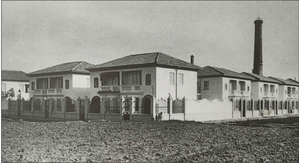
Figura 5 GRUPO DE LA COOPERATIVA DE CASAS BARATAS «LA EMANCIPACIÓN», J. BLAT