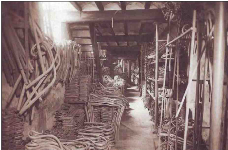
Figura 3 FÁBRICA DE MUEBLES CURVADOS DE VENTURA FELIU. SECCIÓN DE CURVADOS, PRINCIPIOS DEL XX

con una caldera de vapor capaz de producir fuerza con la que mover todos sus telares y devanadoras. Esta fábrica usaba el agua de la acequia de Favara, que una caldera alimentada por leña y carbón se encargaba de caldear para generar vapor y al mismo tiempo se podían hervir los capullos del gusano de seda. La industria, que llegó a ser muy importante en su momento, tuvo hasta trescientos empleados, en su mayoría mujeres procedentes de Picanya y Paiporta, más unas cincuenta, especializadas en la cría del gusano de seda, que procedían de Segorbe. Ya al final de este camino y antes de cerrar el ámbito de análisis, nos encontramos con el Horno de Vidrio Alsina y la Granja de Vacas de la Diputación Provincial.