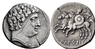
Denario de ikalen(s)ken (ACIP 2071 = CNH Ikalkusken 1)

Esto último ha originado la teoría que quizás incluso ikensakom sería la versión celtibérica del ibérico ikale(n)sken , conocido taller ubicado en la actual Iniesta (prov. de Cuenca) 12 . Se trata de una posibilidad que, si bien interesante, no parece que las actuales evidencias apoyen, ya que no conocemos que se hallan encontrado en Iniesta o en su comarca, la Manchuela, piezas de esta ceca.