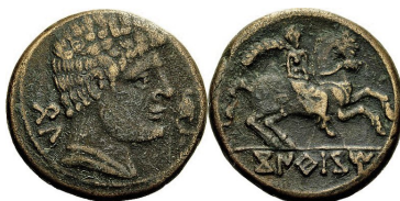
Bronce de Contrebia Belaisca (ACIP 1594 = CNH Konterbia Belaiska 1)

Si bien Complutum figura en las fuentes como perteneciente a la etnia carpetana, la ceca pertenecería al mundo celtibérico 9 o la ciudad es considerada como población celtibera 10 . En cambio, Burillo considera a ikesankom konbouto , junto a kontebakom karbikom , de adscripción carpetana 11 .