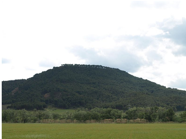
Cerro de San Juan del Viso desde la vega del Henares.

En cuanto a la ubicación de la ceca, el término konbouto 23 se ha relacionado con la ciudad carpetana de Complutum (Alcalá de Henares, prov. de Madrid) (Plin. NH 3, 24. Ptol. 2, 6, 56), por lo que se suele ubicar este taller en la citada localidad de la comarca de La Campiña 24 . Pero no existe seguridad absoluta en cuanto a esta atribución 25 , basada en la homofonía entre el letrero monetario “ibérico” y el topónimo romano.