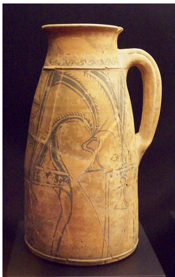
Jarra celtíbera de Izana, ss. II-I a.C.

Soria), donde se localizó un yacimiento celtibérico 37 . La presencia del símbolo delfín relaciona la emisión de ikesankom konbouto con las del valle del río Ebro 38 , aunque hay que señalar que este motivo también se da en otros talleres monetales fuera de la mencionada área 39 . El problema es simple: o la ceca estaba ubicada efectivamente en el valle del río Ebro y no en la Meseta o, al ser una amonedación tardía, copia los modelos que circulan en el área de influencia del taller, los cuales provendrían en mayoría o al menos en una importante cantidad del área del río Ebro. Por ahora, es una cuestión insoluble hasta que no obtengamos más evidencias sobre el particular 40 .