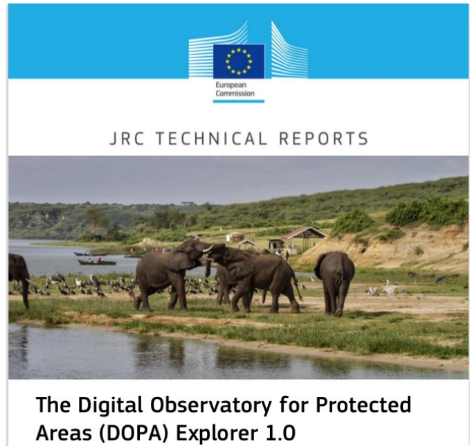
Figura 5. Portada del manual de usuario del Observatorio Digital de Áreas Protegidas (v. 1.0).

Empecé así a trabajar para el centro de investigaciones científicas de la Comisión Europea (Joint Research Centre) en Ispra, Italia, donde me ofrecieron un contrato de tres años con opciones de renovación, como ya me había sucedido años atrás en Alemania. Allí trabajé en el Observatorio Digital de Áreas Protegidas (DOPA; http://ehabitat-wps.jrc.ec.europa.eu/dopa_explorer ), que es una herramienta online que permite a los usuarios evaluar alrededor de 16.000 áreas protegidas a escala mundial en base a sus especies, hábitats y presiones antropogénicas. Se incluyen áreas protegidas tanto terrestres como marinas, y se propone un conjunto de indicadores que ayudan a los usuarios a identificar aquellas con los ecosistemas y las especies más singulares, así como a evaluar las presiones a las que están expuestas debido a las actividades humanas (Figura 5).