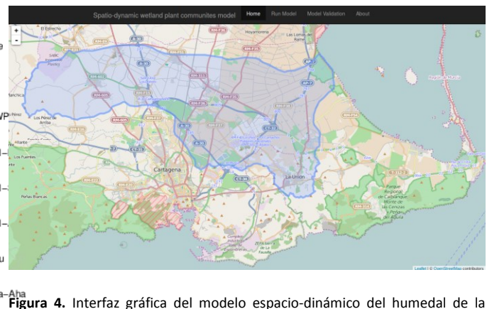
Figura 4. Interfaz gráfica del modelo espacio-dinámico del humedal de la Marina del Carmolí (Murcia, SE España). Online en: http://95.85.28.225/ocpu/library/spdynmodocpu/www .