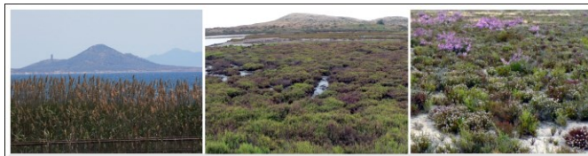
Figura 1. Comunidades vegetales más características de los humedales semiáridos salinos mediterráneos. De izquierda a derecha: carrizal, saladar y estepa salina.

Los humedales semiáridos salinos mediterráneos son ecosistemas semiterrestres sometidos anualmente a períodos prolongados de sequía, y que albergan una biota rica, endémica y vulnerable. En las últimas décadas, la expansión de las zonas agrícolas de regadío en las cuencas mediterráneas semiáridas ha provocado alteraciones en los regímenes de agua y nutrientes en dichos humedales, causando la degradación de estos ecosistemas. Para avanzar en el uso sostenible y conservación de los humedales se necesitan herramientas fiables y sencillas de aplicar que permitan evaluar el estado de la cuenca, así como la manera en que este estado afecta a la evolución de los humedales. En este sentido, la finalidad de mi tesis doctoral fue la de desarrollar, aplicar y validar un enfoque metodológico integrado, basado en entornos libres y abiertos, específicamente adaptado para evaluar el estado ecológico de los humedales de ambientes mediterráneos semiáridos, relacionar dicho estado con las alteraciones hidrológicas de la cuenca utilizando técnicas de teledetección y finalmente elaborar un modelo dinámico espacial de los humedales que pueda ser utilizado en análisis prospectivos.