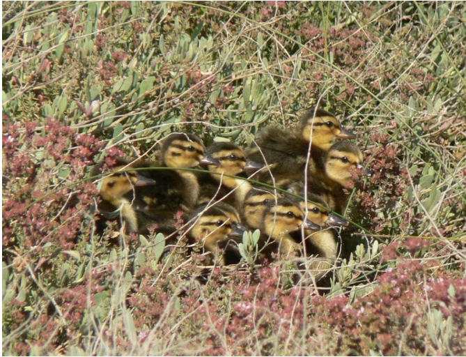
Figura 2. Nido de patos sobre el Halimione portulacoides en el humedal de la Marina del Carmolí.

El tercer capítulo tuvo como objetivo desarrollar un índice de estado ecológico de humedales semiáridos salinos mediterráneos basado en la composición de sus comunidades vegetales, así como probar la aplicabilidad de sensores remotos multiespectrales para cartografiar dichas comunidades. Primero, las comunidades vegetales características de 12 humedales fueron identificadas por medio de trabajo de campo y análisis multivariante en base a los porcentajes de cobertura de los taxones más característicos. Después de desarrolló un índice para evaluar el estado ecológico de los humedales en base de la relación entre la composición de la comunidades vegetales de los humedales y la condición hidrológica de sus cuencas de drenaje. Finalmente las comunidades vegetales de los humedales seleccionados fueron cartografiadas por medio de técnicas de teledetección. Siguiendo esta metodología, se demostró que la teledetección sirve como una herramienta para la evaluación automática del estado ecológico de estos humedales a escala regional.