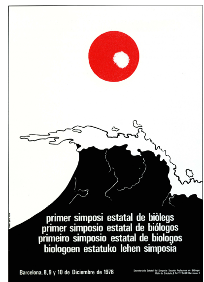
Figura 2. Cartel anunciador del I Simposio Estatal de Biólogos.

El siguiente paso fue la elaboración de unos Estatutos provisionales, que se publican en el BOE de 14 de octubre de