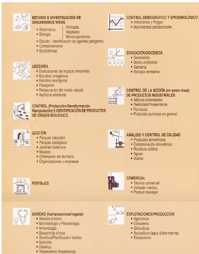
Figura 4. Actividades profesionales de los Biólogos.

No obstante es un hecho que los Licenciados y Graduados en Biología (y titulaciones afines desglosadas de ésta) han estado y están actuando como profesionales en muy diversos campos. El análisis de las posibilidades generadoras de competencias de los contenidos de los estudios a través de encuestas sobre en qué estaban trabajando los biólogos llevaron en su día al COB al listado de las funciones de la profesión de Biólogo que aparecen en el RD 693/1996 en el que se aprueban los Estatutos del COB, dentro de un bloque, el Capítulo IV, que se refiere a los principios básicos reguladores del ejercicio profesional, incluyendo no solamente esas funciones de la profesión (Figura 4), sino también los modos de su ejercicio (Figura 5). Dichas funciones aparecen, prácticamente en los mismos términos, también en los Estatutos de los colegios territoriales. En el Art. 15 de los del COB son éstas: