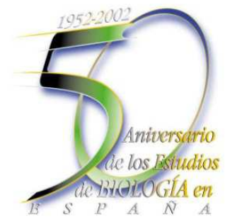
Figura 1. Logo de la celebración de los 50 años de los estudios de Biología.