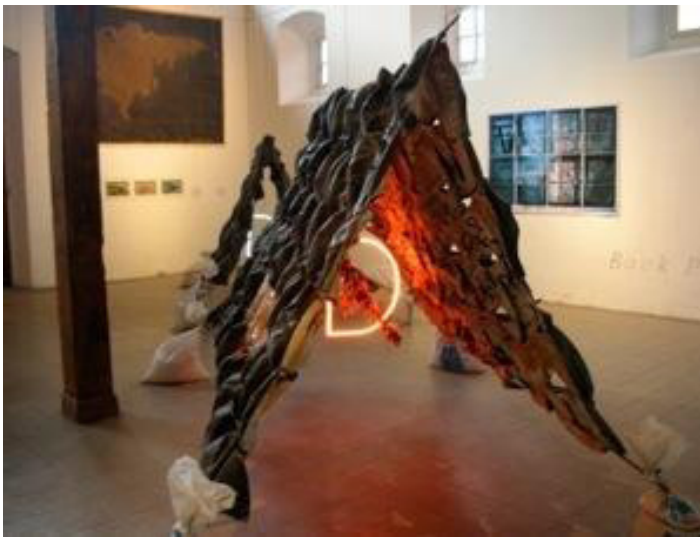
Figura 2. Marcos Lora Read, La Calimba. Juegos Isomorfos , 1994. Caucho, luces de neón, hierro e impresiones. Dimensiones variables.

histórico, antropológico y cultural del Caribe, lo que distingue un modo habitual de su quehacer artístico como creador reflexivo, comprometido e inquieto. Sus medios en la pieza La Calimba. Juegos isomorfos (1994) (Fig. 2), ponen en evidencia una pluralidad de recursos a la que también el artista nos ha acostumbrado desde sus primeras exposiciones individuales en los años 90, especialmente Visión para un pueblo , hasta sus impresionantes instalaciones y performances en Bienales nacionales dominicanas e internacionales de reconocido prestigio. Marcos se ha mostrado en ellas siempre activo, como un permanente buscador de senderos no trillados. Es de los que trabaja intensamente y se muestra en grandes escalas con un arte abarcador y cargado de energías creativas.