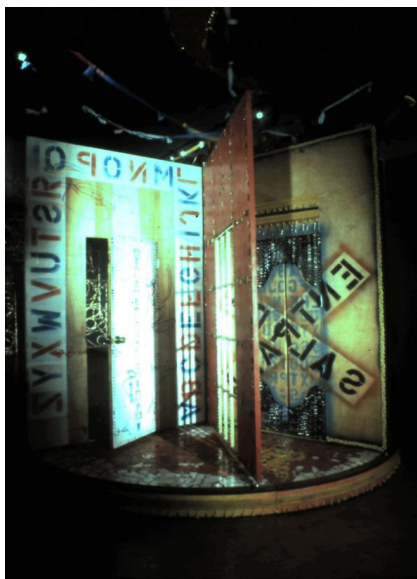
Figura 5. Antonio Martorell, Pasaporte-portacasa , 1994.

Sin embargo, resulta de interés apreciar el modo en que un artista boricua, una de las más importantes figuras de su plástica contemporánea, Antonio Martorell (1939), creador polifacético y con una visión artística siempre polémica, se introduce en el tema de los documentos de viaje con su pieza Pasaporte-portacasa (1994) (Fig. 5), que se presenta a la manera de un pasaporte abierto cuyas hojas interiores son como puertas giratorias. Tal y como su nombre indica, el artista se interesa por el asunto de la libre circulación documentada y los problemas que se presentan en las trayectorias, todos los posibles impedimentos: documentación incompleta o desactualizada, trato desfavorable o de inferioridad, desprecio inmerecido por discriminación por raza, género, sexo, orientación sexual, nacionalidad, origen, religión, condición social o ideas políticas, entre otras posibilidades.