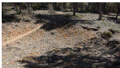
Fig 2. Canteras antiguas de arena de sílice del Pinar de la Vidriera.

El comercio y venta durante años de las piezas de vidrio fabricadas en los hornos de la Vidriera y/o Puebla de D. Fadrique, la falta de documentación sobre estos centros de producción, la destrucción y desaparición de estos lugares históricos y sus producciones, el expolio y la escasa protección de este patrimonio cultural y minero, ha dado lugar a que en la actualidad no hayamos encontrado apenas publicaciones, documentos, catálogos, inventarios o colecciones de vidrios en las que aparezcan referencias a los hornos y vidrios del Pinar de la Vidriera o Puebla de D. Fadrique. El trabajo de campo si ha permitido la localización de las canteras de arena de sílice (Fig. 2) y la zona de posible ubicación de los hornos del Pinar de la Vidriera.