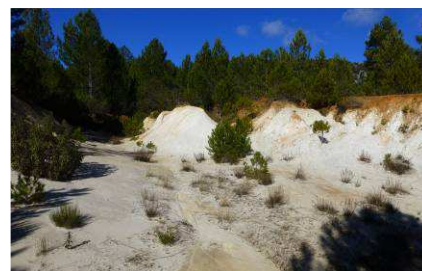
Fig 3. Canteras de arenas silíceas del Eoceno de Nablanca.

En Nablanca, polje kárstico cercano a Puebla de D. Fadrique, encontramos también afloramientos de arenas blancas de sílice del Eoceno (Fig. 3).