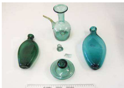
Fig. 4. Conjunto de piezas de vidrio halladas en Puebla de D. Fadrique.

posible fuente de materia prima del horno vidriero del Pinar de la Vidriera, así como de las piezas de vidrio halladas en Puebla de D. Fadrique, que por su cercanía podrían haberse fabricado en la citada Vidriera. (Fig. 4).