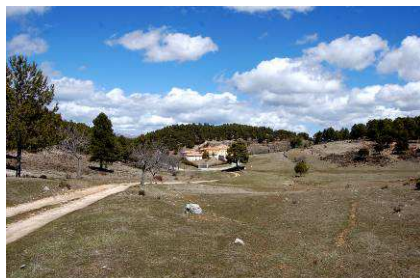
Fig. 5. Vista parcial del sinforme de la vidriera con formaciones del Mioceno medio.

El horno vidriero del Pinar de la Vidriera se ubica en el flanco noroeste de un sinforme que presenta dos formaciones: areniscas silíceas y calizas bioclásticas del Mioceno medio. (Fig.5).