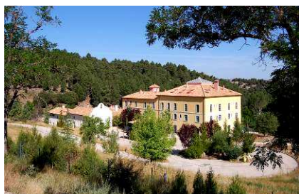
Fig 1. Casas del Pinar de la Vidriera.

Las Casas del Pinar de la Vidriera (Fig. 1) y Puebla de D. Fadrique, aparecen en los documentos antiguos como algunos de los centros de producción de vidrio más importantes de Andalucía oriental desde la edad media hasta el siglo XIX, así se refleja en las memorias de los museos arqueológicos provinciales (Extractos de 1948-49) de 1950 donde se puede leer: "Los hornos vidrieros de Castril, Puebla de D. Fadrique, Pinar de la Vidriera, en la provincia de Granada, y de María, en la de Almería, muy famosos sobre todo en la época musulmana, continuaron sus trabajos hasta el siglo XIX, en que desaparecieron al industrializarse estas manufacturas".