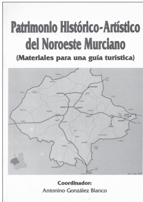
FOTO 3. TÍTULO: PORTADA DEL LIBRO: Patrimonio Histórico Artístico del Noroeste Murciano .