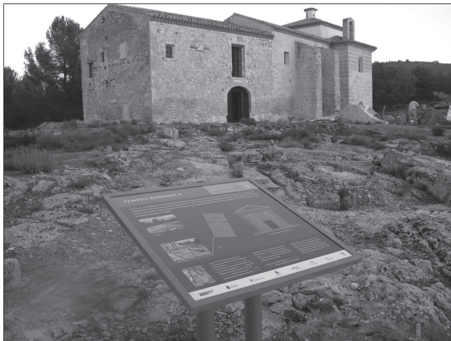
FIGURA 2. Ermita de la Encarnación y Casa del Ermitaño.

En una época aún por determinar el templo romano fue abandonado y quizás fuese reutilizado durante el periodo islámico, pero de manera residual y desde luego habiendo desaparecido todo componente de carácter sacro. Tras la conquista castellana y la formación del Reino de Murcia se recupera este espacio para el culto cristiano. El conjunto monumental de la Ermita de la Encarnación queda delimitado por una cerca de mampostería de la que aún quedan algunos vestigios que cerraba la propia ermita y la casa del ermitaño, un espacio amplio utilizado como colmenar y un aljibe. El primer templo cristiano debió ser construido (aprovechando la cella y pronaos del templo romano) por la Orden de Santiago en el segundo cuarto del siglo XV aunque sólo aparece documentado en el año 1494. Sin embargo fueron las obras acometidas entre 1554 y 1557 las que confieren a la ermita su fisonomía actual: planta de cruz latina, bóveda de medio cañón, tambor rematado por linterna (fig. 2). En su interior se disponen dos altares colaterales dedicados a San Antonio