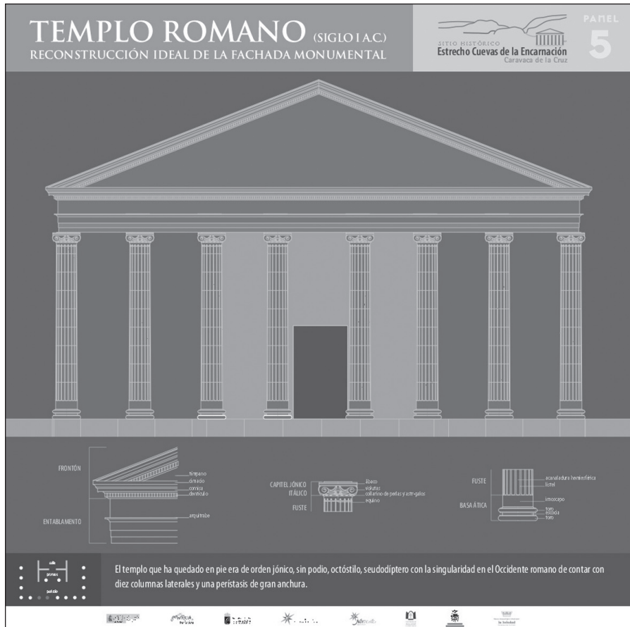
FIGURA 3. Restitución interpretativa de la fachada principal del templo B.

en espuma de poliuretano que están disponibles en el almacén de la propia Casa del Ermitaño. Su reducido peso permite una fácil manejabilidad por parte del alumnado, de esa manera los grupos organizados podrán proceder a su colocación en los lugares correspondientes, fundamentalmente en la fachada del Templo B o en el peristilo. De esa manera y mediante un procedimiento lúdico pueden obtener una imagen bastante aproximada de la realidad huyendo en gran medida de las abstracciones. El guía arroja su explicación del Templo romano marcando con un puntero sobre un dibujo que reconstruye la fachada del templo los diversos elementos arquitectónicos, mientras que el alumno coloca las basas y fustes de columna en su lugar correspondiente, de forma que un sencillo juego se convierte en un excelente recurso didáctico (fig. 3).