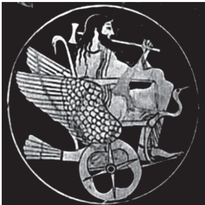
FIGURA 5. Hefesto conduciendo un carro Hiperbóreo. Dibujo sobre cerámica, ca. 525.

abierta y las piernas unidas formando una sola 47 . Cuando Hesíodo llama a Hefesto amphigyeéis , «doblemente mutilado» 48 , nos está ofreciendo una imagen similar a la del egipcio Bes, un grande-pequeño genio o dios asimilado a Ptah y representante también del hongo sagrado 49 . En un dibujo sobre cerámica de ca. 525 BC (fig. 5), hecho por un tal Ambrosio, vemos a Hefesto conduciendo un carro adornado con motivos animales relacionados con el mundo Hiperbóreo: el cisne 50 en la parte de