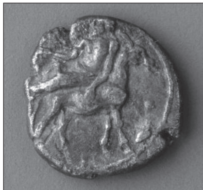
FIGURA 4. Moneda griega mostrando a Dioniso reclinado sobre un asno.

Dioniso y los Sátiros representan la embriaguez, mientras que Hefesto es sólo el dios de la forja, el fuego y los volcanes, pero Hefesto también pertenece al grupo de dioses fúngicos una-pierna , ya que se quedó cojo de niño 44 : tenía como ayudantes a los Dáctilos, dioses de naturaleza fúngica harto conocida 45 , pero su propia cojera ya le incluye en el grupo de dioses que, por tener sólo un pie o una pierna funcional (o sea, cojos ), constituyen representaciones fúngicas sobre todo de Soma, dios hindú cuya esencia es el hongo enteogénico Amanita muscaria . Hesíodo clarifica aún más esta condición fúngica al llamar a Hefesto « El muy ilustre cojo de ambos pies » 46 : no se trata de que Hefesto tenga sólo un pie funcional, sino que era cojo de ambos pies, de modo que formaban una unidad, relacionando estrechamente a nuestro dios con la Eleusina Baubo, una diosa menor a la que se representaba con la vulva