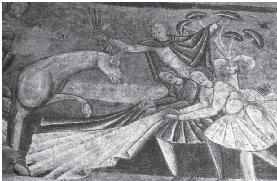
FIGURA 6. Entrada de Jesús a Jerusalem montado en un asno. Véase el hombre encaramado al árbol-hongo a la derecha. Saint-Martin de Vic (France).

Jerusalem a lomos de un asno (fig. 6); en ella podemos ver un árbol-hongo de cuyas ramas se cuelga un hombre, como si quisiera coger uno de los hongos 68 , apareciendo en el mismo contexto que el asno de Jesús.