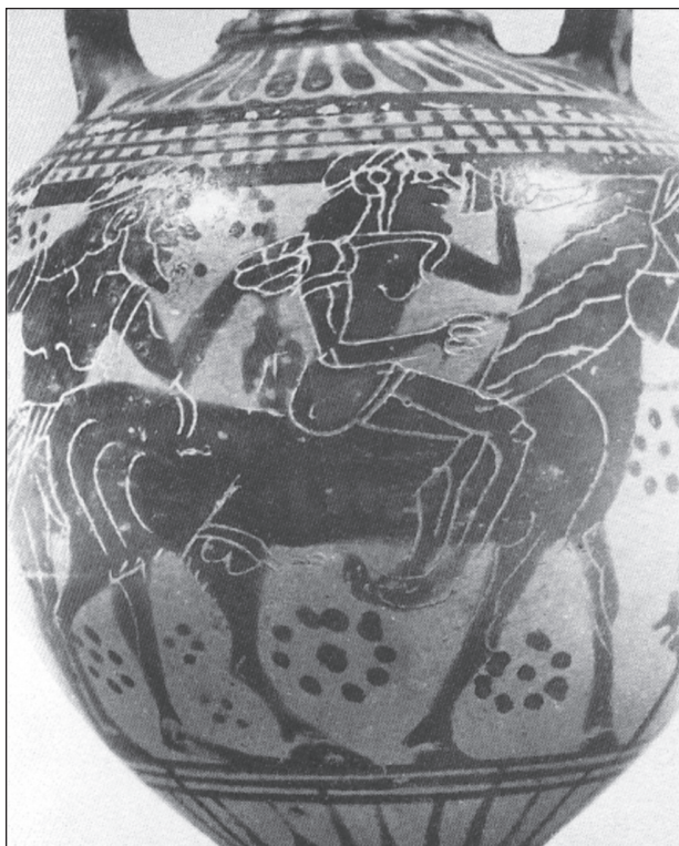
FIGURA 2. Hefesto, emborrachado por Dioniso, regresa al Olimpo a lomos de un asno. Ánfora corintia de principios del siglo VI a. C.

En este episodio Hefesto queda asociado tanto al asno como a la embriaguez, como si «cabalgar un asno» y «emborracharse» fueran expresiones equivalentes e inevitables. Podemos hallar la misma idea en las palabras del mitólogo latino Higino, quien nos dice en una de sus Fábulas que «nuestros antepasados tenían en las patas de sus triclinios cabezas de asnos enlazadas a parras, recordando que un asno fue el descubridor de la dulzura del vino» 43 ; una antigua moneda griega muestra esta asociación: un asno sujeta un racimo de uvas con su boca (fig. 3). Este hecho identifica claramente a Dioniso, descubridor clásico del vino, con los asnos, de modo que podemos afirmar que Dioniso podría aparecer bajo el aspecto de un asno porque el asno era parte de su naturaleza: no en vano, otra moneda lo muestra en actitud embriagada a lomos de uno de estos animales (fig. 4).