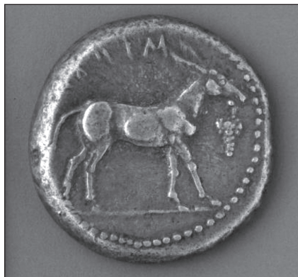
FIGURA 3. Moneda griega que muestra a un asno frente a un racimo de uvas que cuelga de su boca.