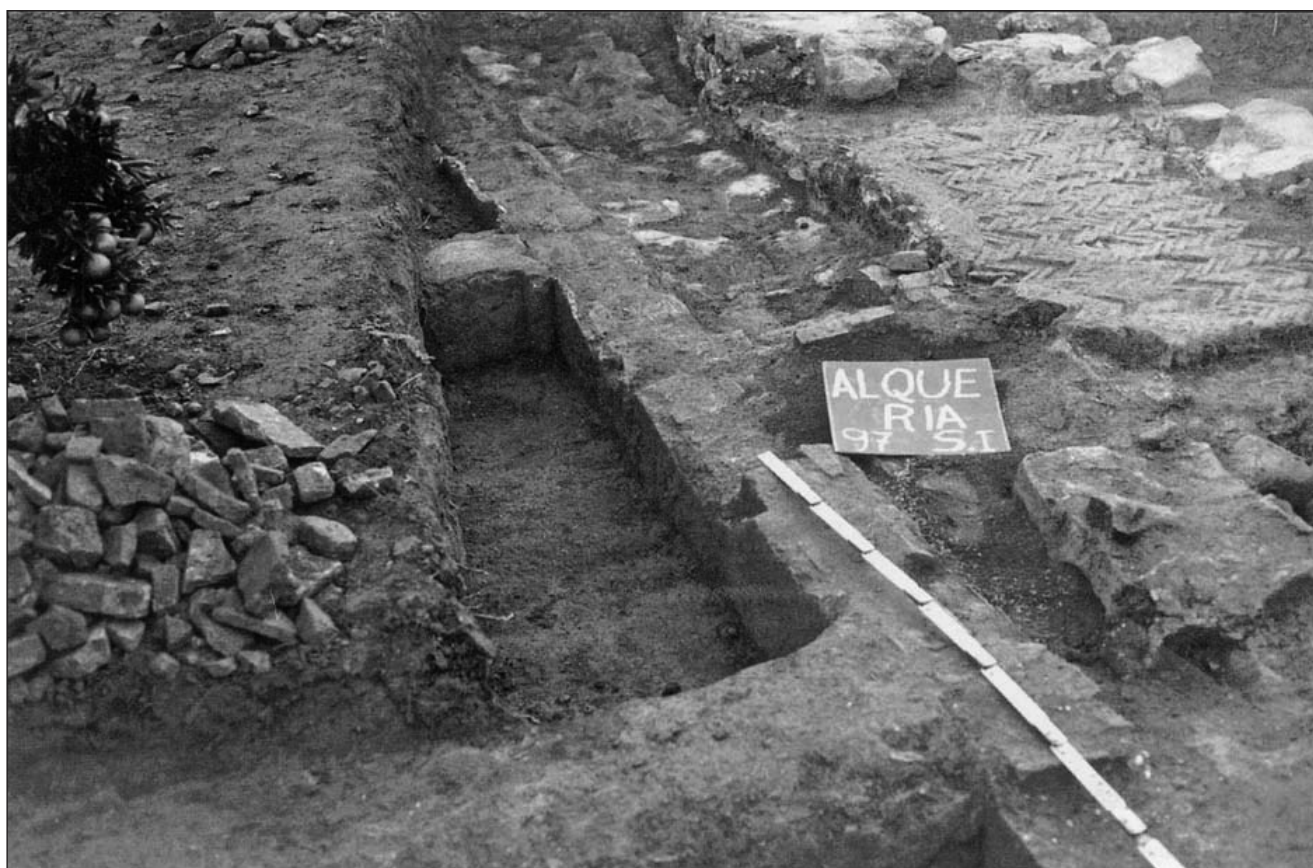
Lámina 2. Sondeo I de L'Alqueria (Moncofa) (según Oliver – Moraño, 1998, lám. I).

cientes a una villa. Quedaron a la vista los restos de algunas habitaciones situadas en la zona norte del conjunto, entre las cuales había algunas de planta cuadrada y otra rectangular de grandes proporciones con un pavimento de mortero que desaparecía bajo la parcela meridional (Arasa, 1995, 812-814). Aunque su atribución es insegura, podría tratarse de una cella vinaria . Hacia el sur, en un huerto de naranjos, continúan los restos que parecen corresponder a la pars urbana de la villa. Las cerámicas recogidas proporcionan una amplia cronología entre los siglos I y V d.C.