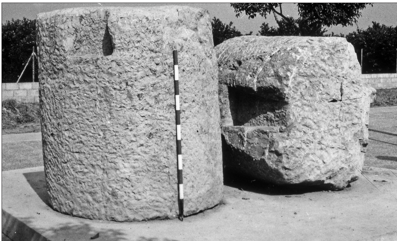
Lámina 1. Contrapesos de prensa de La Torrassa (Betxí-Vila-real).

fiere de la recogida en la bibliografía (Márquez – Molina, 2005, 293, n.º 278). En la segunda mitad del siglo II se fecha un enterramiento encontrado frente a los hornos que confirma el abandono de las instalaciones.