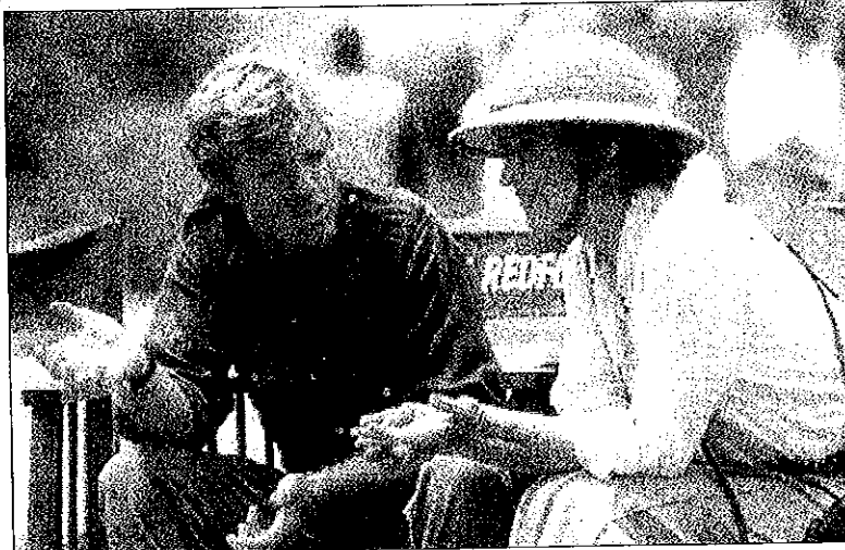
Robert Redford lo que más desea es hacer películas, bien sea como director, actor o productor.

A Robert Redford le parece maravilloso que Clint Eastwood, cumplidos los 62 años, sea este verano el actor y director del momento en Hollywood. "El éxito de Eastwood nos demuestra a los que pasamos de los 50 años que todavía hay muchas cosas que hacer y que contar", dice Redford, que está terminando el montaje de su tercera película como director, A river runs through it , basada en la novela del mismo título de Norman McLean, publicada en 1976 por vez primera, y de la que ya se han imprimido catorce ediciones en los Estados Unidos.