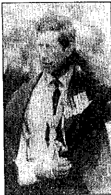
Carlos de Inglaterra.