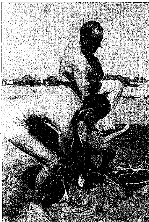
Ministro y embajador se descalzan antes de zambullirse.

Eran las primeras horas de la mañana del 17 de febrero de 1966. Servidor tenía 26 años y llevaba dos ejerciendo la profesión. Un reportaje