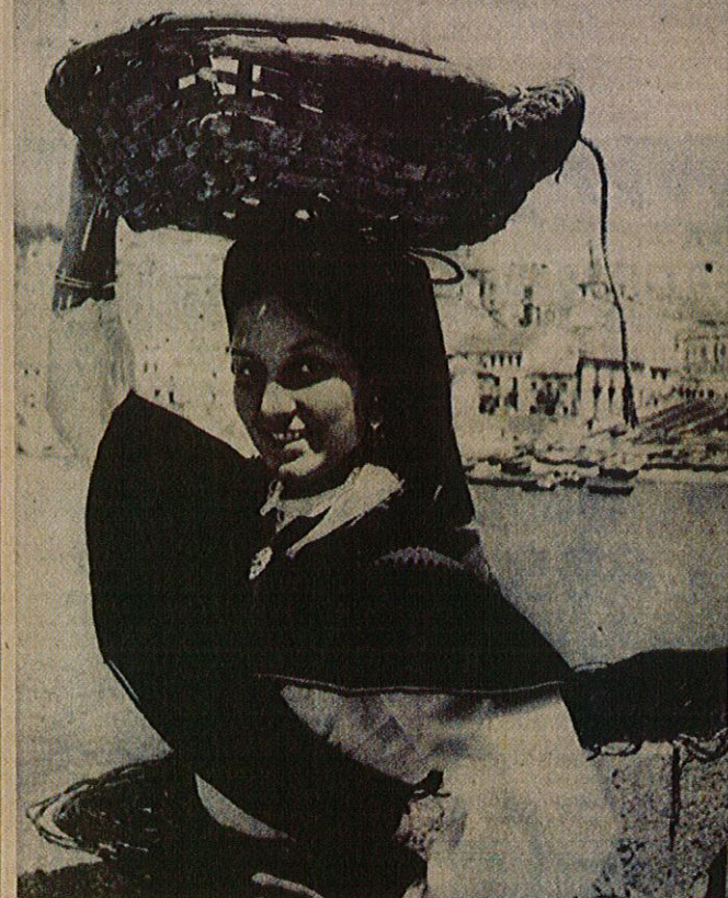
Ella sabe que han sonado las sirenas de los barcos que regresan de la pesca. Una larga costumbre—no importan demasiado los años para el caso—le hace salir cada mañana, al romper el alba, hacia el rompeolas donde los pescadores van a descargar su viva mercancía. Limpia y adornada como para una fiesta, luciendo lo mejor que guarda en el gastado arcón de su cuarto, ella sonríe por aquello de que el mar es una promesa repetida que llena cada mañana su viejo cesto de vendedora. En un pueblo cualquiera, al amparo de una ría cualquiera de Galicia, una muchacha cualquiera. Pero, eso sí, una sonrisa especial frente al mar de cada día