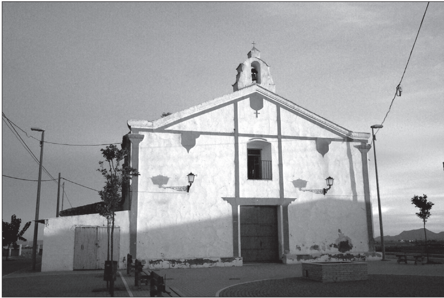
FIGURA 2: Ermita de los Ríos. Junto a ella se celebró durante más de siglo y medio la subasta de las aguas de Lobosillo. Durante el siglo XX, en el pequeño salón que está pegado a su izquierda, se subastaban tanto las aguas viejas como las aguas nuevas.

por medio de una subasta semanal que tiene lugar todos los domingos por la mañana después de misa, bajo mi presidencia, un fiel de fechos y la voz pública 12 , siendo el remate por día y tipo desde un real de vellón hasta la más alta cantidad que se lo lleva el que da más por el, de entre los labradores.