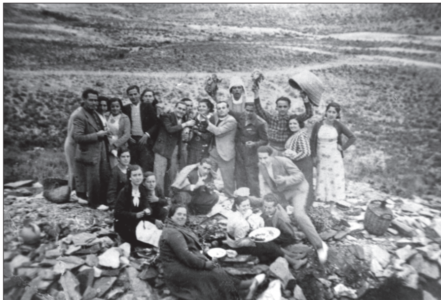
FIGURA 6: Comida campestre en El Pantano, hacia la década de 1940. Este lugar, situado junto a la finca Villa Antonia, recogía aguas de los canales formando un pequeño embalse donde los vecinos solían ir de excursión en determinados días.

Foto cedida por los vecinos de Lobosillo para la exposición montada por Luis Pardo.