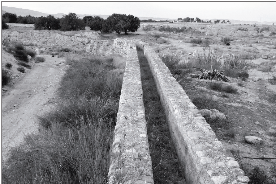
FIGURA 1: Antiguo cauce de Casa Grande hacia Lobosillo. Este cauce quedó inutilizado al romper una avenida el acueducto sobre la rambla del Albuñón.