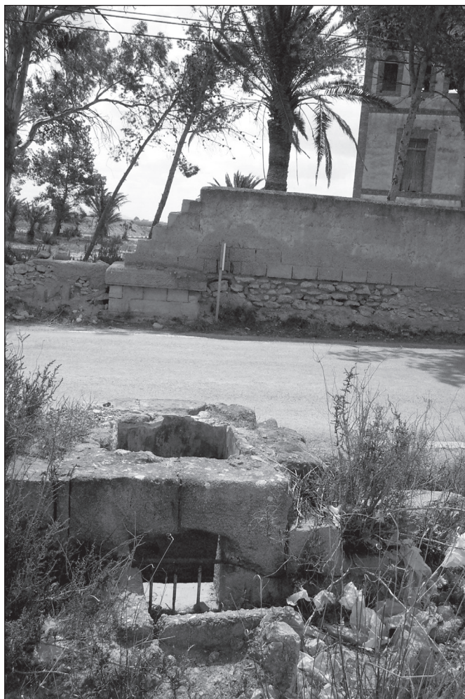
FIGURA 9: Restos en piedra tosca de un sifón de los antiguos cauces que salvaba un camino en Torre Calín.