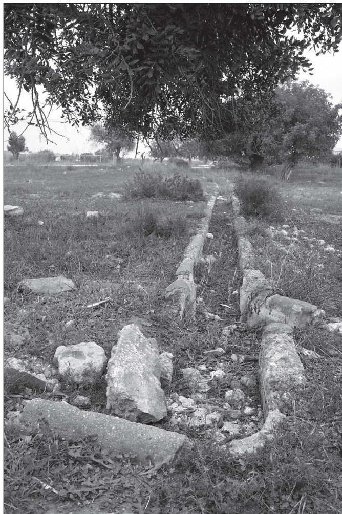
FIGURA 7: Restos inutilizados de los antiguos cauces a su paso por Lobosillo.