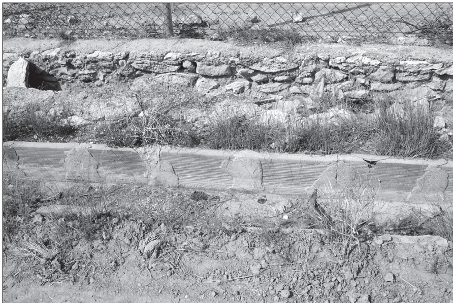
FIGURA 10: En algunos tramos los cauces de las aguas viejas y las aguas nuevas corrían paralelos. En la parte superior, en piedra viva con argamasa, las aguas viejas, y en la inferior, con ladrillo, las aguas nuevas.