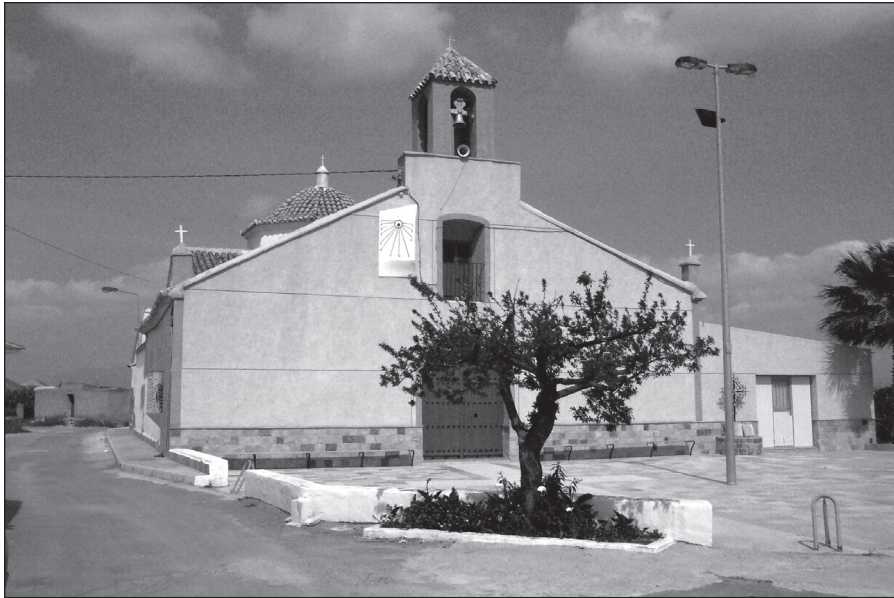
FIGURA 8: Ermita de La Mina, en la diputación de El Albuñón, término de Cartagena. Se trata del otro lugar donde se celebraban subasta de aguas, en este caso la de los cauces de Casa Grande.