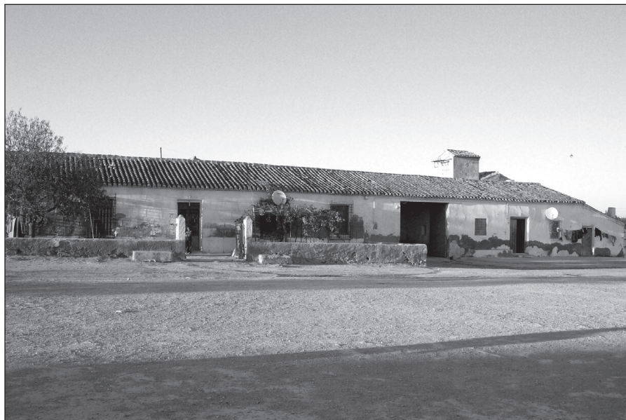
FIGURA 3: Casa Lo Girón. Casa matriz de la hacienda la familia Girón, constructores de los canales de las aguas de Lobosillo a principios del siglo XIX. Fue derribada en 2007.

que las aguas eran tan abundantes que con un incremento en la profundidad de los canales podría cuadruplicarse la cantidad de agua extraída 17 .