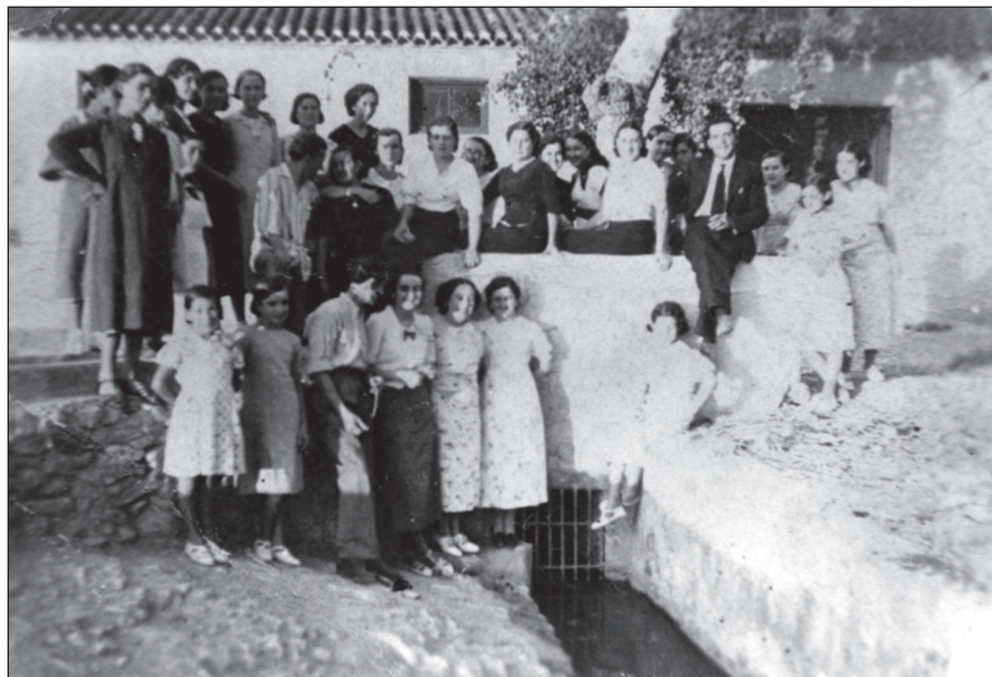
FIGURA 4: Reunión hacia la década de 1950 en uno de los molinos que funcionaba con la fuerza de las aguas de los viejos canales, posiblemente el de Sabas en El Estrecho.

Asimismo, y por esos años, al parecer en la zona de Fuente-Álamo se extraía de los cauces agua para riego mediante su elevación por norias 25 .