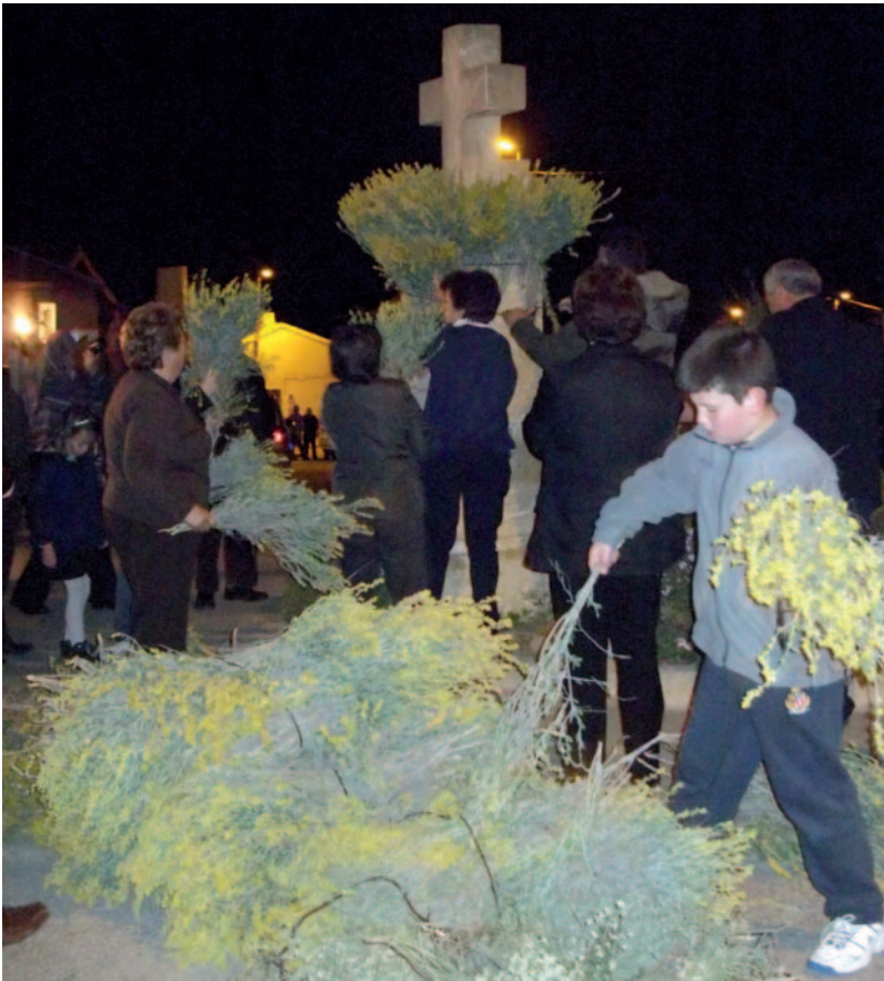
Fig. 2: “Vistiendo” el pedestal de la Santa Cruz con ramos de albaída y boja blanca.

Casi a la una de la madrugada quedaba «vestida» la Santa Cruz, entre cohetes y voces femeninas exclamando «¡Vivas!» a la patrona, y un aplauso general.