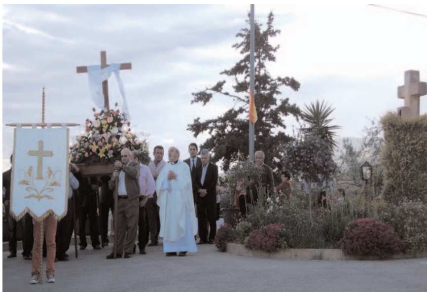
Fig. 3: Plegaria de la comitiva procesional ante la Santa Cruz «vestida».