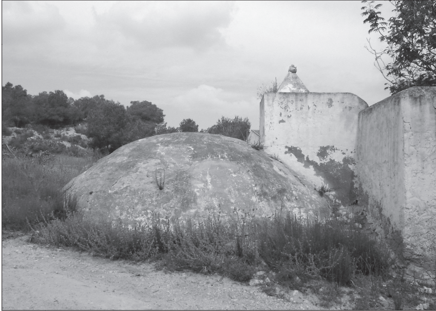
Aljibe de «Contiendas de Arriba».