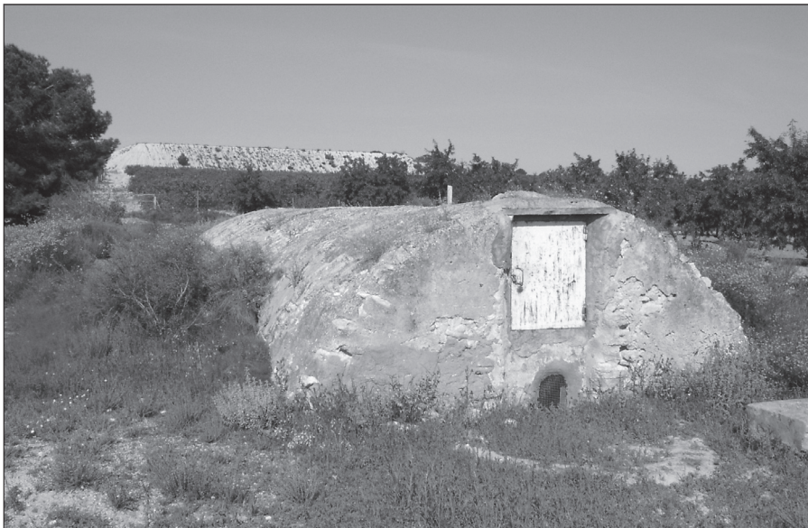
Aljibe de «Pino Escarzo».