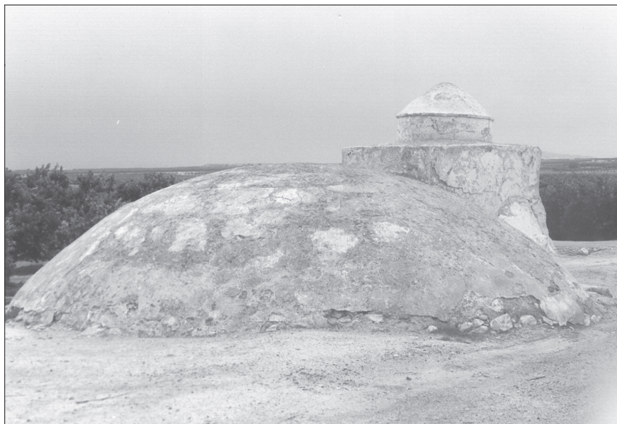
Aljibe de «lo Romero».