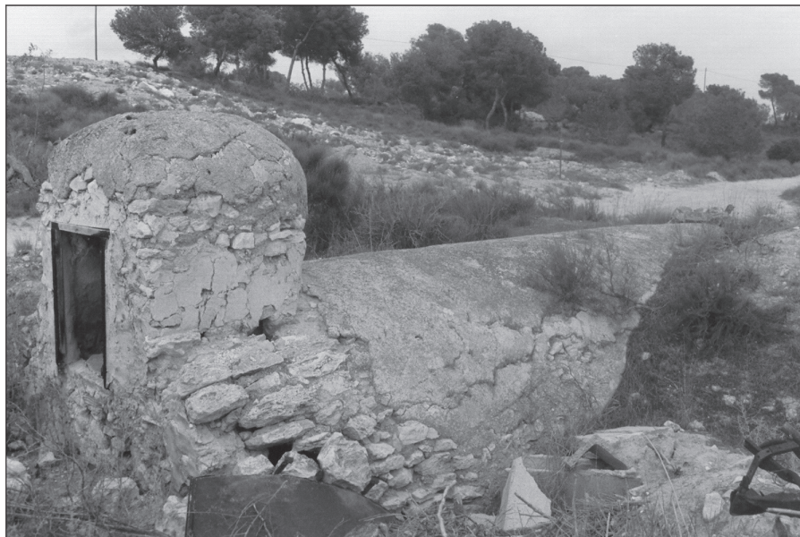
Aljibe de «Siete Higueras».