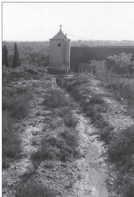
Aljibe de «las Chatas».