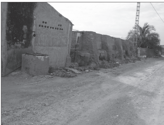
Aljibe en el camino de la Raya.