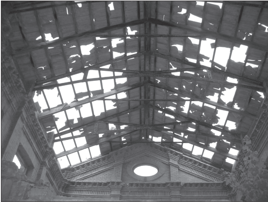
FIGURA 6: Vista interna de la cubierta del depósito n° 1 en Canteras (Cartagena).

de la compañía propietaria del mismo. La primera planta coronado por un frontón triangular, está decorada por una serie de óculos elípticos verticales y horizontales, así como por tres ventanas rectangulares en cada lado.