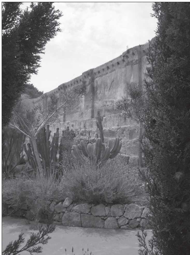
FIGURA 4: Vista exterior del depósito n° 2 en Canteras (Cartagena).

La edificación, de aspecto bastante sólido, tiene planta cuadrangular de 30 m de longitud y 21,50 m de anchura, coincidente con su eje central sobresale a modo de fachada en su lateral sur un pequeño cuerpo rectangular de 8,50 m de longitud y apenas 4 m de anchura, en el que se aprecia la puerta de acceso adintelada, aunque tapiada en la actualidad.