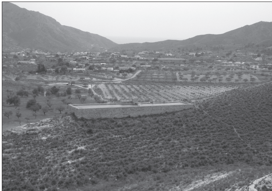
FIGURA 1: Balsa de agua en la Loma de la Asomada. Cartagena.