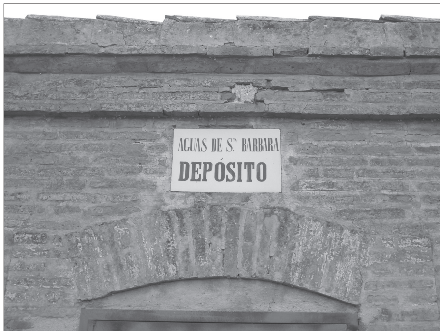
FIGURA 8: Azulejo sobre la entrada del depósito de los Molinos Marfagones (La Magdalena, Cartagena).

La edificación realizada en ladrillo macizo, está cubierta con teja curva sobre una sola vertiente que produce que el alzado del edificio sea decreciente hacia su