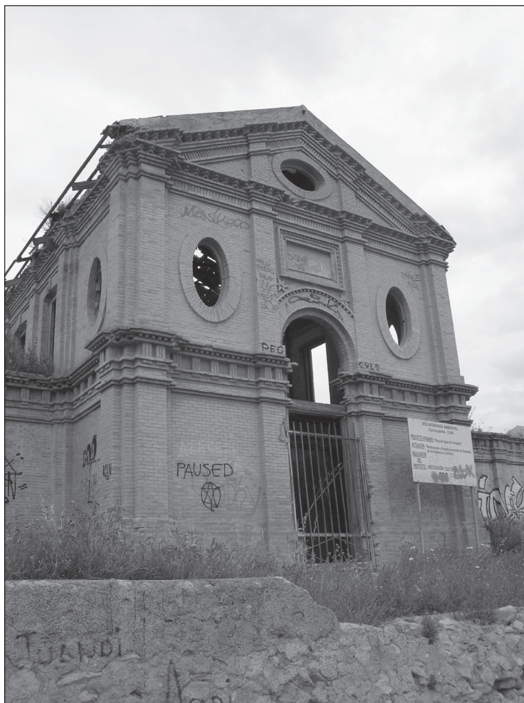
FIGURA 7: Detalle de la fachada del depósito n° 1 en Canteras (Cartagena).

depósito central. Al respecto, de lo que no hay duda es que por esta zona discurría el agua, tal como lo evidencia la pared curva que une el lateral del aliviadero con la pared del arco centrado con la puerta de acceso.