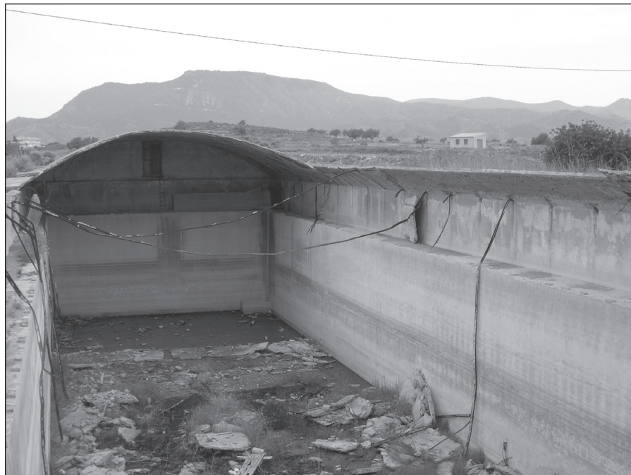
FIGURA 3: Interior del depósito de agua de Collado Mochuno (Casas de Belmonte). Cartagena.

El edificio estaba cubierto por bóvedas de cemento armado de 10 cm de espesor, 18 m de luz y 3 m de flecha. Hoy día la mayoría de las planchas de la bóveda aparecen desplomadas en su interior. (Figura 3).