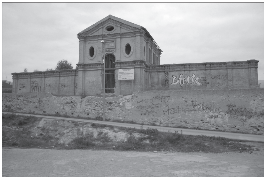
FIGURA 5: Vista general del depósito n o 1 en Canteras (Cartagena).

En el centro del cuerpo adelantado se encuentra la puerta de acceso originalmente de madera, decorada por un arco inscrito en el vano sobre el que se ubica una cartela rodeada por molduras en la que se localizaría la dominación del depósito o