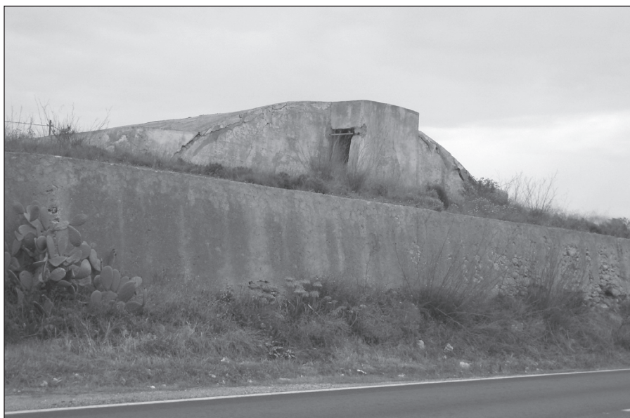
FIGURA 2: Fachada del depósito de agua de Collado Mochuno (Casas de Belmonte). Cartagena.