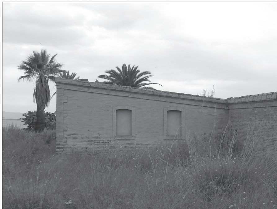
FIGURA 9: Detalle del exterior del depósito de los Molinos Marfagones (La Magdalena, Cartagena).

parte trasera, como lo evidencian los 2,40 m de altura en la zona delantera de la nave principal frente al 1,60 de su parte trasera. (Figura 9)