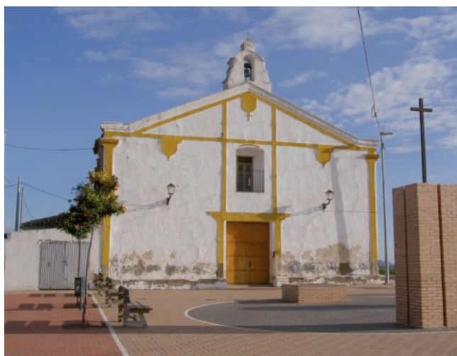
Ermita de Los Ríos. Lobosillo.