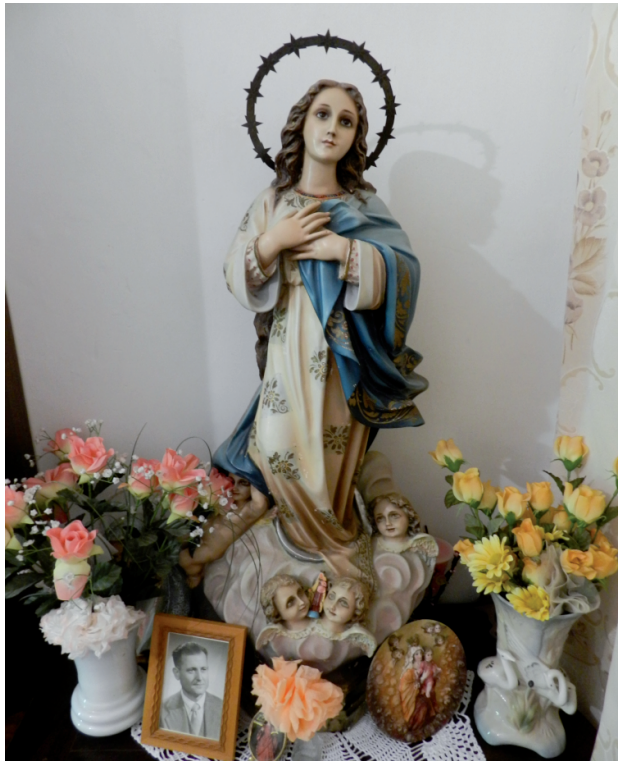
Capillita privada en La Tercia.

Y también como manifestación fehaciente de la fe popular, como demuestra la existencia, aún hoy en día, de las hornacinas viajeras, con la Virgen del Rosario, que de casa en casa los vecinos albergan y trasladan sus plegarias, para el beneficio de la familia y de los allegados, con el deseo de que la Virgen esté siempre con ellos.