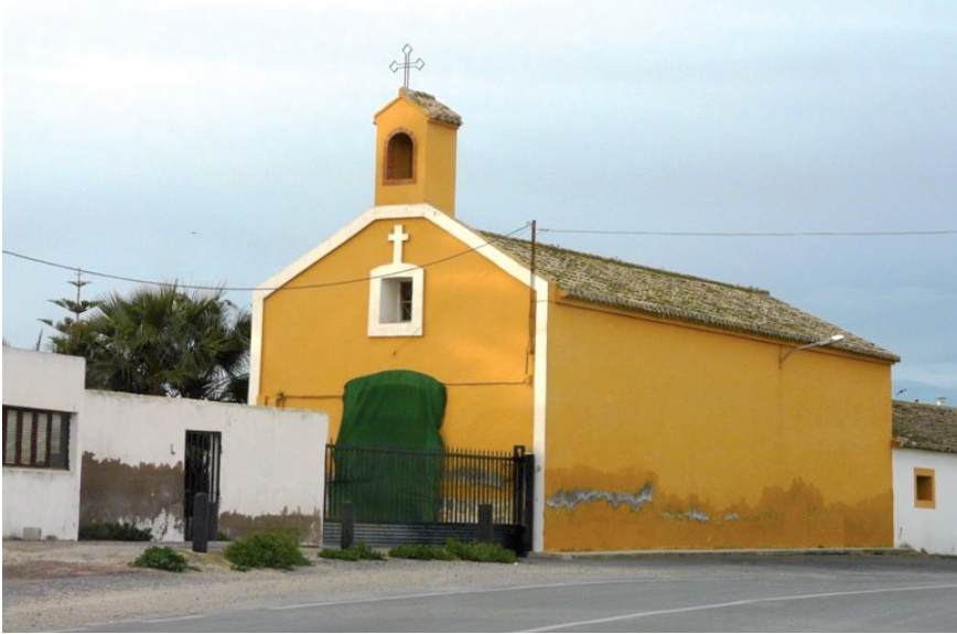
Ermita de Lo Campuzano. Los Martínez del Puerto.

La pretensión de sus creadores, la idea principal de los señores que ubicaron esa ermita en sus posesiones, se ha cumplido ciertamente, y los habitantes del lugar recuerdan con cariño y emoción la ermita que les dio todo lo que actualmente tienen. La ermita en despoblado tenía el significado propio de la existencia de la hacienda del señor, no obligaba al poblamiento en torno a ella; al revés, se quería independiente, para un tiempo preciso de culto, para la espiritualidad total.