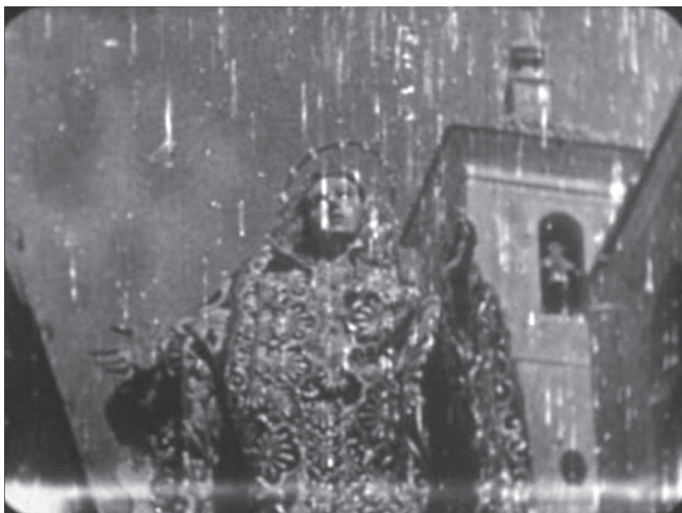
Ilustración 5. Dolorosa de Salzilla y al fondo, campanario de la iglesia de San Bartolomé de Murcia, Val del Omar, documental Semana Santa en Murcia , 1935