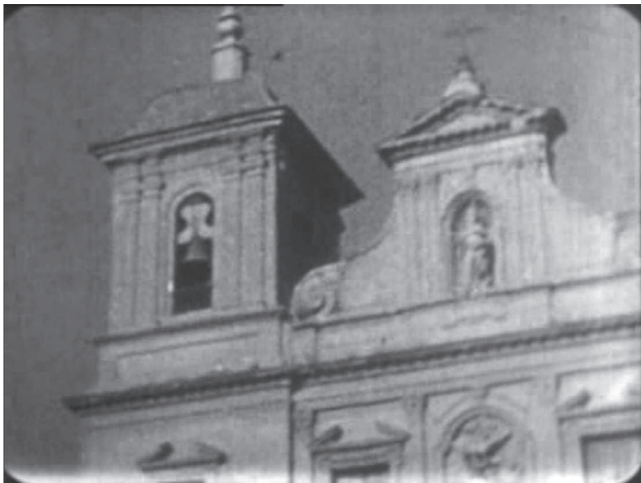
Ilustración 3. Espadaña desaparecida de la iglesia parroquial de San Andrés y Santa María de la Arrixaca de Murcia, Val del Omar, documental Semana Santa en Murcia , 1935