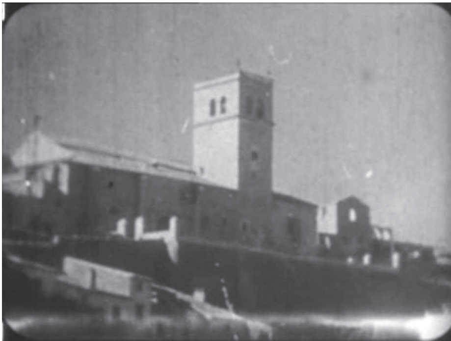
Ilustración 1. Fotograma de la iglesia de Santa María de Lorca, Val del Omar, documental Semana Santa en Lorca , 1934