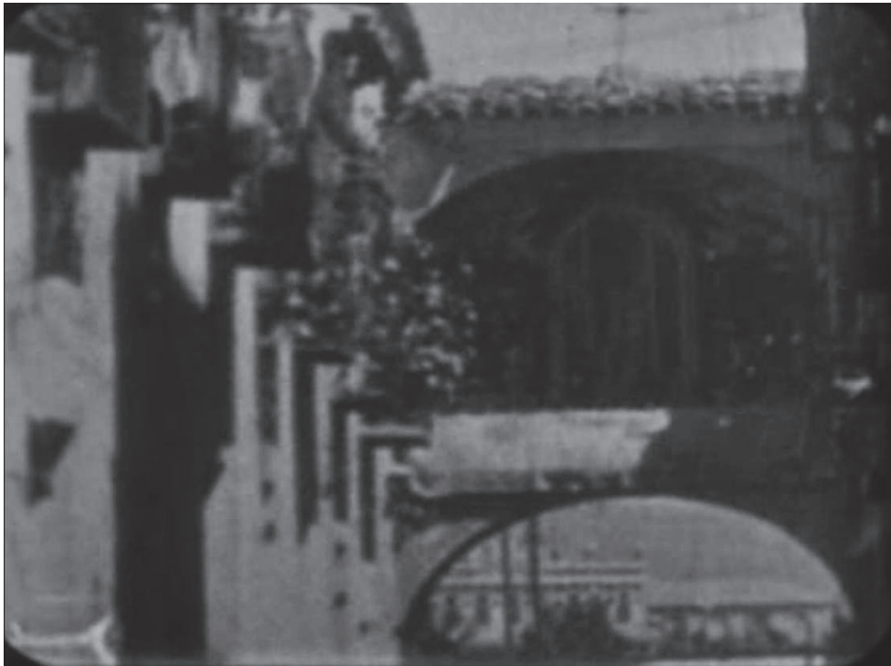
Ilustración 6. Arco de la Aurora, Val del Omar, documental Fiesta de la Primavera en Murcia , 1935