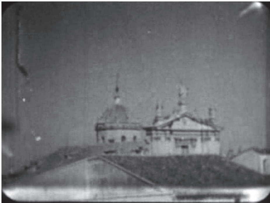
Ilustración 2. Fotograma de la parte superior de la Colegiata de San Patricio donde se ubicaba el original Ángel de la Fama, Val del Omar, documental Semana Santa en Lorca , 1934