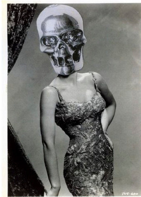
Figura 7. Los monstruos de Hollywood , María Cañas, 2010.

Estas figuras mutantes, que nos miran y nos asoman a la más absoluta alteridad, condensan cuestiones esenciales para la práctica y la estética feminista: la reinscripción del cuerpo femenino como significativo, la ruptura de la identificación entre feminidad y corporeidad y la dislocación de los parámetros bajo los que ciertos cuerpos se catalogan como femeninos. En definitiva, son figuras provocadoras que, según se miren, contienen una promesa liberadora.