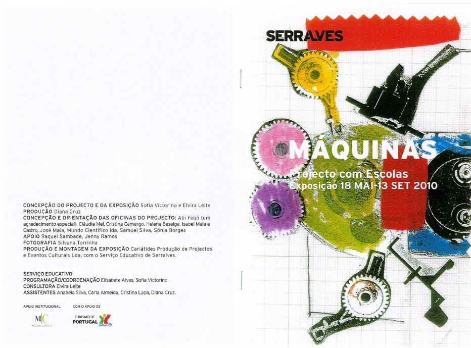
↑ Figura 1. Programa de Mano editado por la Fundación Serralves con motivo de la muestra de los resultados del Proyecto anual con Escuelas en su edición 2010. .

En ese sentido, y a raíz de una estancia realizada en mayo del 2010 en la Faculdade de Bellas Artes de Oporto, tuvimos la oportunidad de comprobar de primera mano la eficacia y fidelidad de los planteamientos teóricos recogidos en la mencionada publicación. Así, asistimos a una exposición en el Museo de Serralves titulada: Máquinas . Dicha muestra resultaba de una actividad educativa de carácter anual vinculada a los Projectos com Escolas promovidos desde el Servicio Educativo de la Fundación.