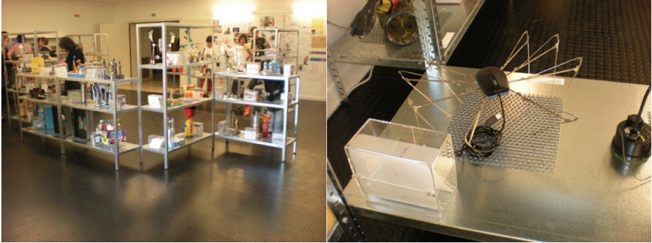
↑ Figura 2. Vista panorámica y detalle de la Sala de la Fundação Serralves que acogió la muestra del Proyecto com Escolas titulado "Máquinas".

Durante un año lectivo, concretamente desde el 1 de octubre del 2009 hasta el 12 de septiembre del 2010, se realizaron en la Fundação de Serralves un conjunto de actividades y seminarios que aglutinaban diversas temáticas: arte, ciencia, tecnología, sostenibilidad. Dinamizando la colaboración entre artistas, científicos, educadores y alumnos. Finalmente, entre el 18 de mayo y el 13 de septiembre del 2010, una selección de los mejores trabajos fue mostrada en una de las principales Salas del Museo Serralves, estableciendo un diálogo con artistas de renombre como Dara Birnbaum.