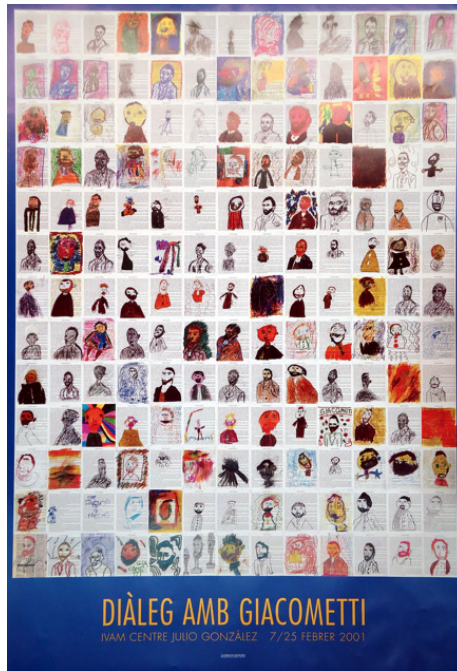
↑ Figura 7. Cartel editado por el IVAM con motivo de la muestra titulada: Diàleg amb Giacometti resultado del taller didáctico con el mismo título y que se mostró en la Galería 3 del museo entre el 7 y el 25 de febrero de 2011.

La muestra tuvo el mismo tratamiento que cualquier otra exposición realizada por este museo, prueba de ello es que fue mostrada en la Galería 3 del IVAM y aunque no se editó un catálogo, se realizó un cartel que reunía una pequeña muestras de lo expuesto mediante la reproducción de 109 trabajos.