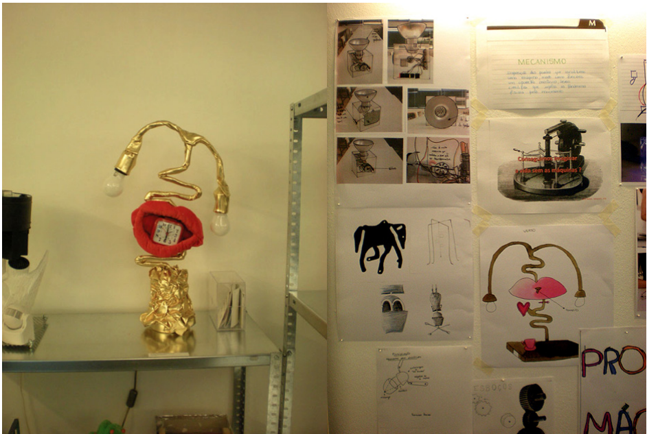
↑ Figura 3. Como se puede apreciar en esta vista confrontada entre el diseño dibujado en papel y el aspecto final de la obra, la muestra tenía pretensión de dar visibilidad al proceso creativo desde su origen.

El gran nivel, tanto artístico como educativo de la propuesta, nos llevó a considerar las posibilidades que ofrece este modelo de proyecto educativo basado en la muestra y exhibición final de los resultados alcanzados. Las obras mostradas pertenecían a más de 40 centros educativos de diversas zonas de Portugal y de muy diversos niveles educativos (desde pre-escolar hasta las enseñanzas secundarias)