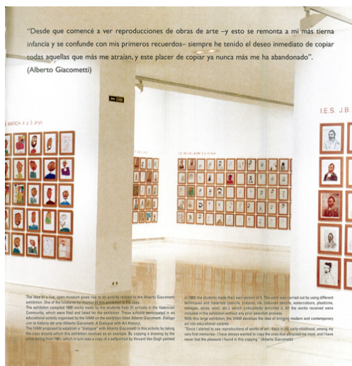
↑ Figura 6. Vista panorámica de la Galería 3 del IVAM con todos los trabajos realizados en el taller didáctico: Diàleg amb Giacometti. Imagen procedente del catálogo editado por el IVAM con el título: Los talleres didácticos del IVAM 1998-2005. Educational workshops of the IVAM. Pág. 138. Disponible en http://www.ivam.es/catalogopdf/0437/#!/136/