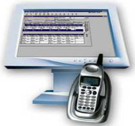
Fig. 5 Verificadores de voz