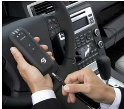
Figs. 7-8 Sistemas de control de adicciones a distancia