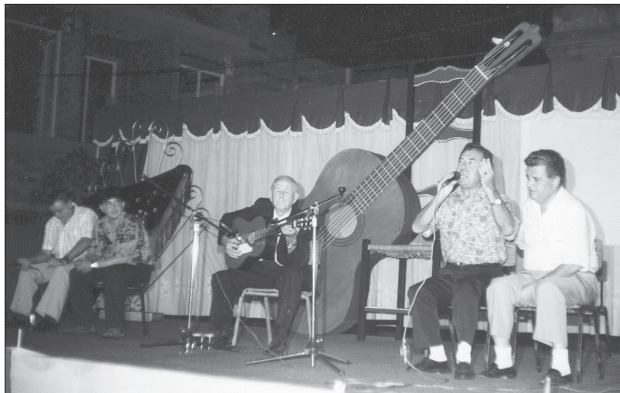
1991 EL ALGAR Certamen Nacional del Trovo de Cartagena.