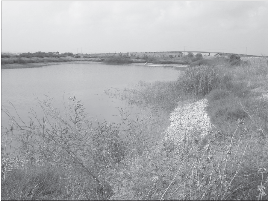
Abua embalsá pal reguerío.