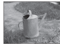
Arrujera pa riegár las almajaras.

sencial de la vivienda campusina. Con l'allegá del abua corriente a fincas y caserisos y con er llenao de los depósitos con pipas ( cubas ), estos arjibes han perdío su antañona utilizaúra, aunque angunos dellos tavía testimoniarmente ofrecen su típica silueta esterna, fricuentemente, com'una contrución d'obra abombá apegá a la cuala s'alevanta la parte der brocal.