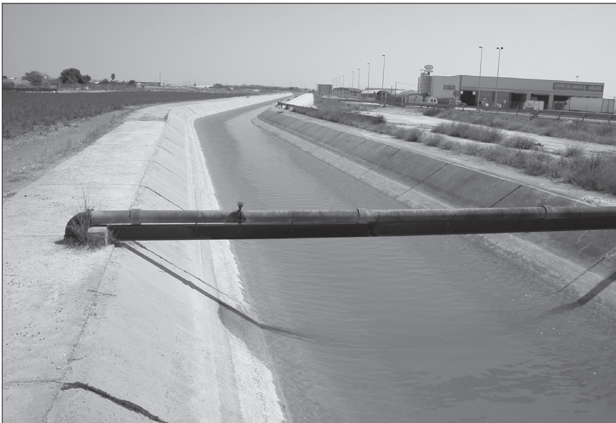
Acieca mayor, esfise general.