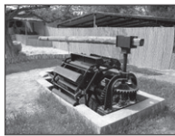
Almijarra, barra d'enganche duna bestia.