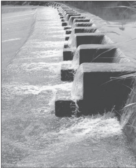
Azul, pa derivar abuas.