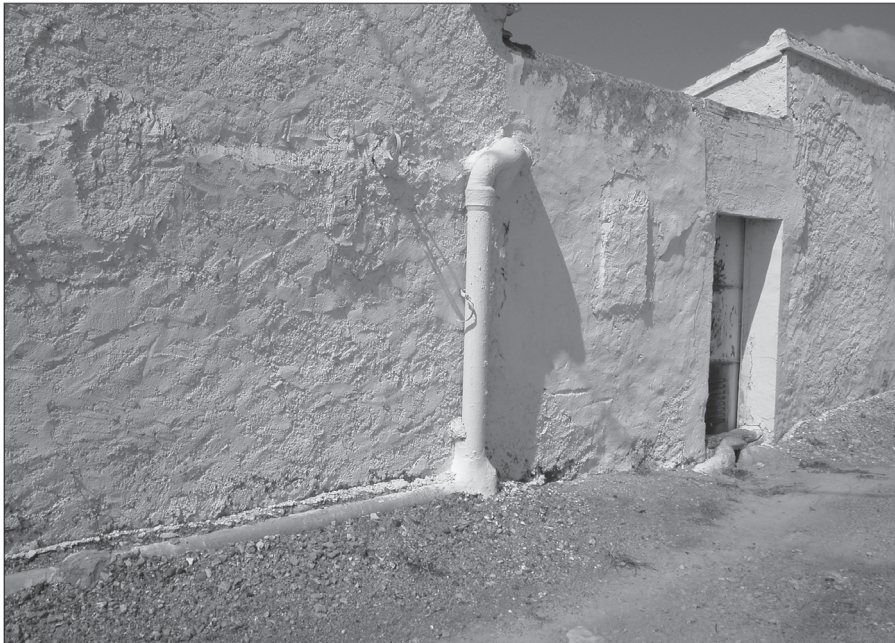
Abocante al aljibe de las abuas del terrao.