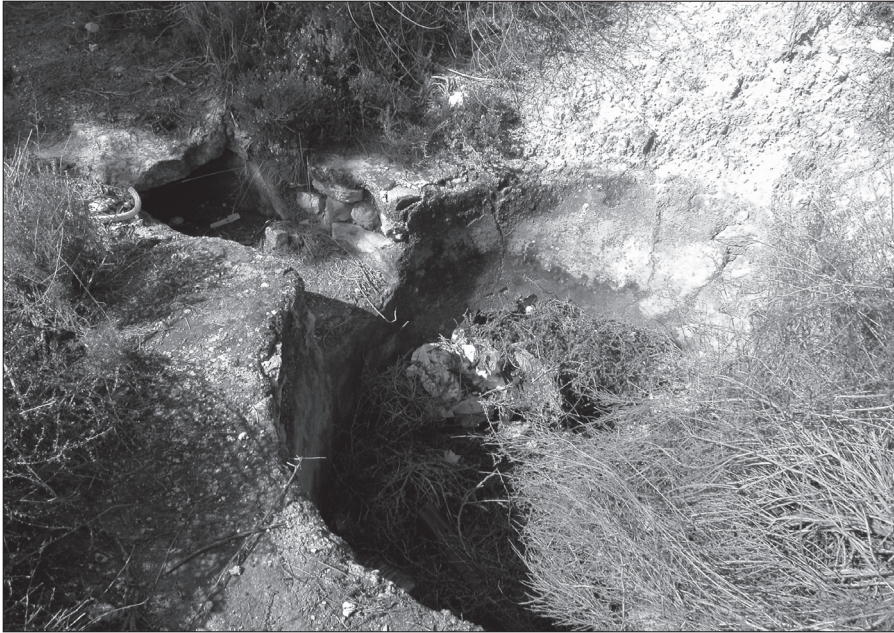
Aclaraor pa la entrá del abua al aljibe.