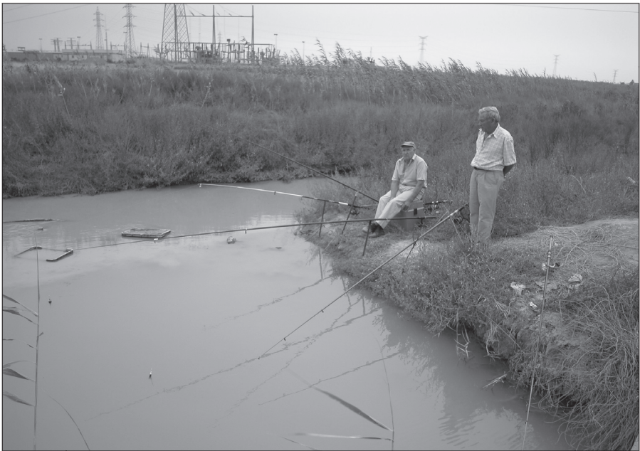
Aboque dun cauz en otro.