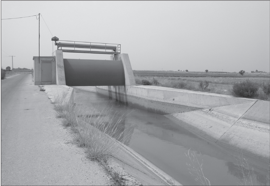
Acieca mayor. Canal del trasvase con pará mecánica.