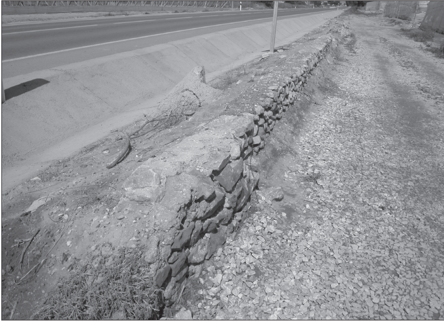
Acieca en ruinas apegá a la carralera de Sucina-San Javier.