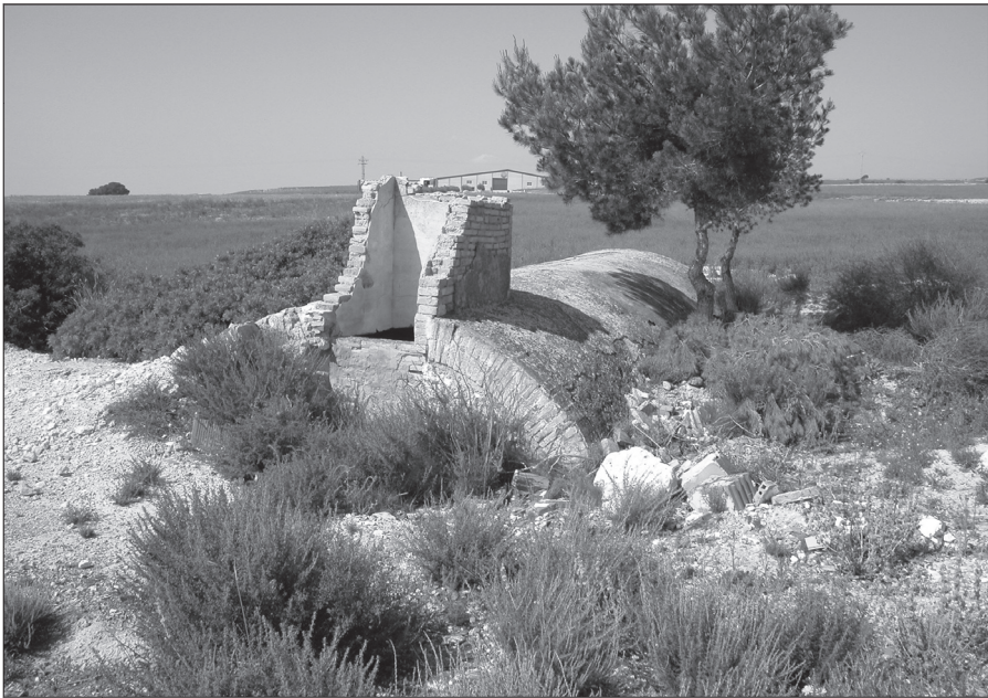
Aljibe de bóvea.