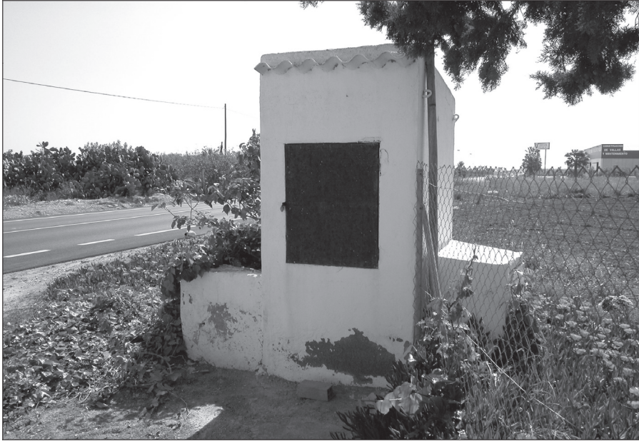
Aljibe con brocal y pila de lavar.