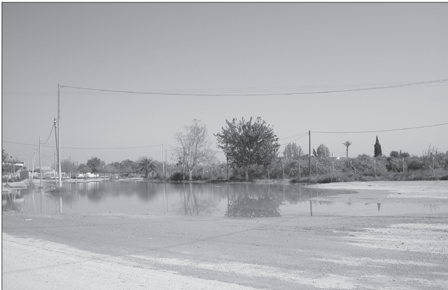
Achurtalamiento dimpués duna llovía.