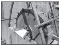
Aceñil, movío por los pieses.