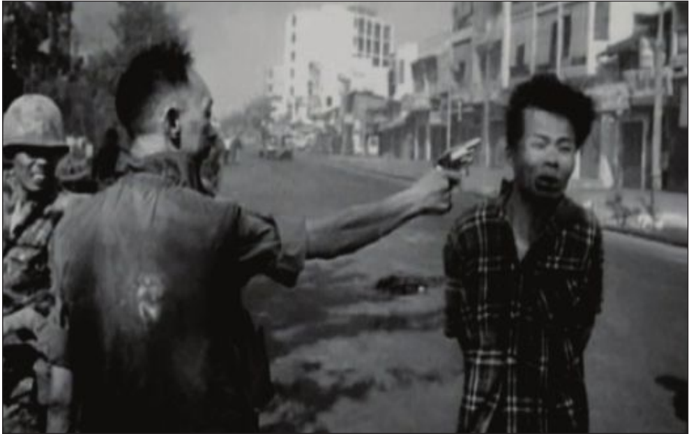
Eddy Adams. Policía survietnamita disparando a un prisionero del Vietcong. Imagen galardonada con el Pulitzer en 1969.