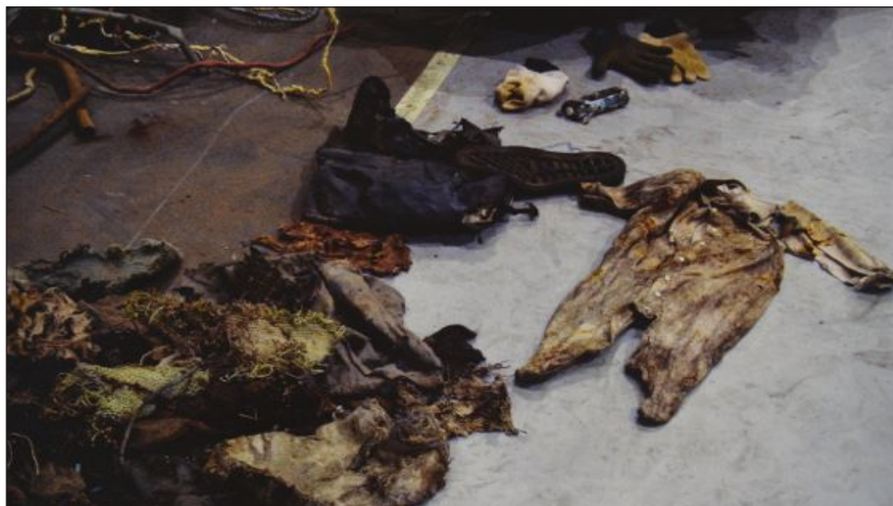
Personal Effects, perteneciente a Memory Remains, 9/11 Artifacts at hangar 17, de Francesc Torres.

Por último, gracias a varios artículos del New York Times, 4 hemos tenido noticia de que algunos de los restos que habían sido custodiados todos estos años, junto a otros localizados recientemente, están siendo identificados, y esto estaba dando lugar a reacciones antagónicas por parte de los familiares de las víctimas: aquellas que piden que no se les comunique que han encontrado un nuevo trozo de hueso, un fragmento de músculo o cualquier otra parte del cuerpo de sus seres queridos para poder pasar página, y la postura, quizá más frecuente, de los que reclaman cada nuevo resto identificado, a pesar de las dificultades que esto supone a la hora de lidiar con el duelo. Desde un principio se hizo un esfuerzo para tratar de esconder los cuerpos, y el hecho de que doce años después se siga identificando a las víctimas, y que se siga intentando ocultar en la medida de lo posible, 5 si no ya sus imágenes sí el hecho en sí mismo, hace que nos replanteemos ciertas cuestiones acerca de las imágenes que nos llegaron del 11-S.