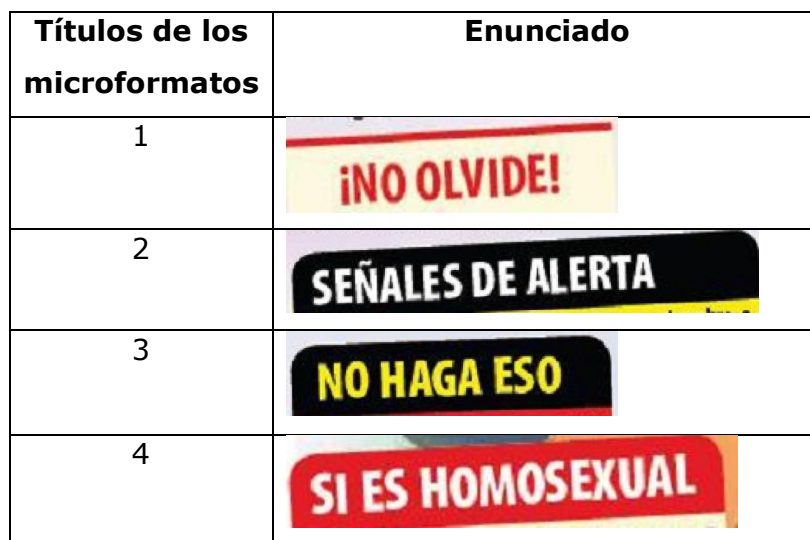
Tabla 1: Títulos de los microformatos

Estos títulos contribuyen a (re)construir el campo semántico de la homosexualidad en donde esta es asociada con el peligro : “¡NO OLVIDE!”, “SEÑALES DE ALERTA”, “NO HAGAS ESO”, “SI ES HOMOSEXUAL”. De igual manera, el microformato cuatro, que lleva por título, “SI ES HOMOSEXUAL”, organiza el contenido en ítems subtítulos así: “PRIMER PASO”, “SEGUNDO PASO”, “TERCER PASO” y “CUARTO PASO”. Los títulos e ítems conservan el tono instructivo e imperativo propuesto desde el sumario. La negación verbal producida a partir del adverbio no que antecede al verbo: “¡NO OLVIDE!”, “NO HAGAS ESO”, contribuye a la fuerza semántica de la instrucción, lo que se refuerza gracias al uso de los signos de admiración o exclamación.