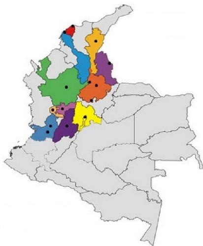
Ilustración 1: Regiones de Colombia en donde circula Q'hubo

Q'hubo es un periódico colombiano tipo tabloide publicado por el Grupo Nacional de Medios (GNM) en doce departamentos del país: Atlántico, Antioquia, Bolívar, Caldas, Cauca, Cesar, Cundinamarca, Norte de Santander, Risaralda, Santander, Tolima y Valle del Cauca. Aunque el periódico circula a diario en estas regiones, su edición no es la misma; de tal forma, si bien posee igual nombre y estructura, sus contenidos son diferentes. El proyecto editorial nació el 1 de