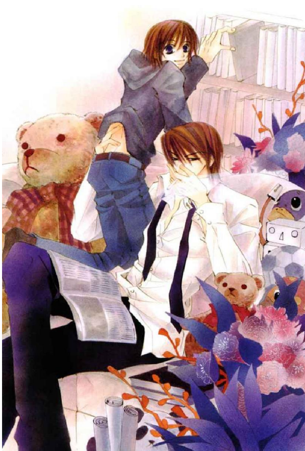
Ilustración 4: JunjōRomantica

La imagen que acompaña la nota informativa pertenece a un personaje del manga JunjōRomantica llamado Takahashi Misaki . El manga es un género discursivo creado en Japón similar a las historietas o cómics que posee múltiples subgéneros y estilos de dibujo. Estos textos se adaptan a otros formatos multimodales: series de animación conocidas como anime, películas, videojuegos, entre otros. JunjōRomantica pertenece al subgénero Yaoi y fue creado por ShungikuNakamura, una famosa mangaka japonesa. El Yaoi da a conocer relaciones de amor entre hombres.