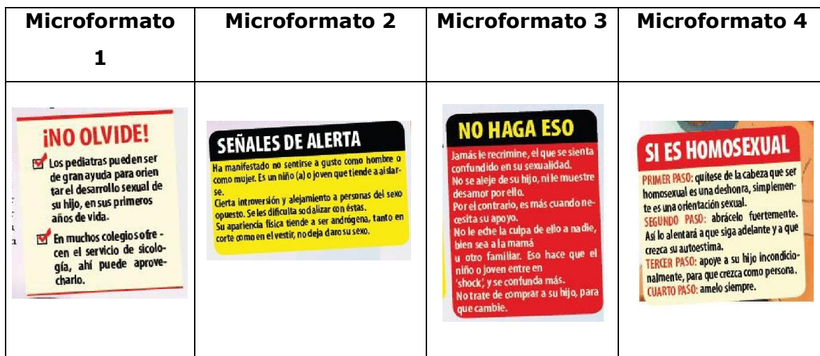
Tabla 2: Microformatos de la nota informativa

El microformato, como elemento destacado del texto, está conformado por un título corto seguido de un breve escrito o cuerpo: